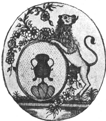
Fig. 14 Exlibris des Pfarrers A. N. R. Häfliger.

Die Familie Häfliger, Häffliger, Häflinger oder Hefflinger wird seit dem 13. Jahrhundert urkundlich vielfach erwähnt.