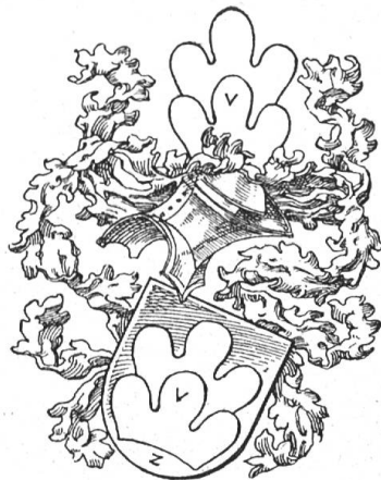
Fig. 40 Wartenberg.