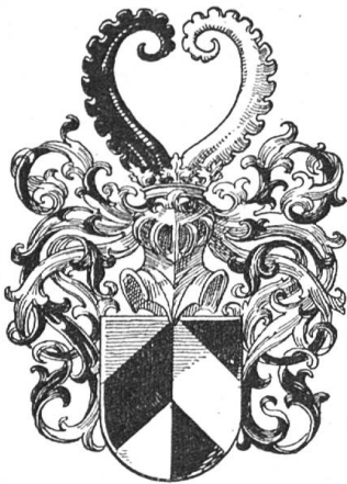
Fig. 48 Sürilin (Zchg. Roschet).

Im Jahre 1440 war Konrad Kilchman als Zunftmeister in den Rat gekommen, 1446 wurde er Ratsherr und starb anfangs 1454.