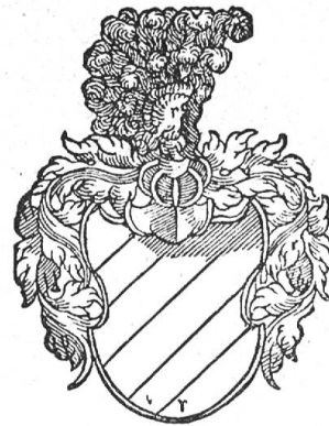
Fig. 56 von Brunn (nach Wurstysen).

Das Original des Wappenbestätigungsbriefes wurde zu Beginn des achtzehnten Jahrhunderts von Johann von Brunn mitgenommen, der nach Mainz