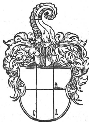
Fig. 44 v. Hegenheim (nach Wurstyzen).

Q: W. Altmann, Reg. K. Sigm. Nr. 10977. — Aug. Burckhardt, Basler Jahrbuch 1909, 109. — Basler Chroniken VII, 348/9.