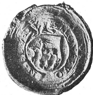
Fig. 64 Siegel des Landammanns Nikolaus v. Flüe 1557.

Trotz der Bestimmtheit dieser Angaben ist die Nachricht sehr unzuverlässig, ja direkt falsch. Die Be- zeichnung Liber Riti beruht sicher auf einer Verwech- slung mit dem bekannten Liber Vitae des Propst Bir- cher, dessen Entstehungsdatum 1621, nicht 1619 ist, und dessen Wappen keineswegs etwa auf eine ältere