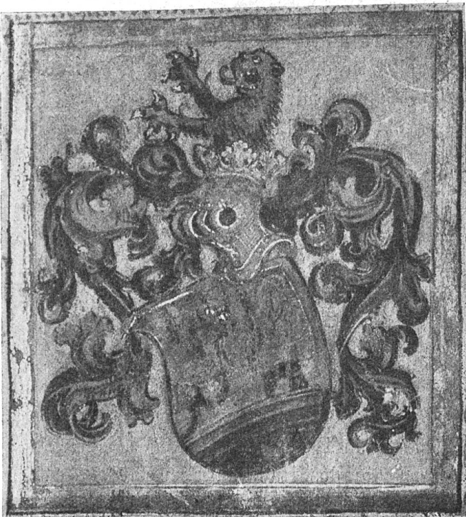
Fig. 61 Kilchman