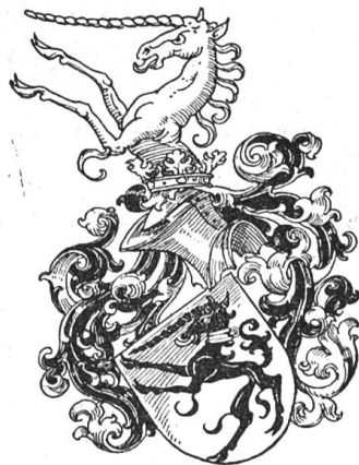
Fig. 50 v. Waltenheim (Zchg. Roschet).