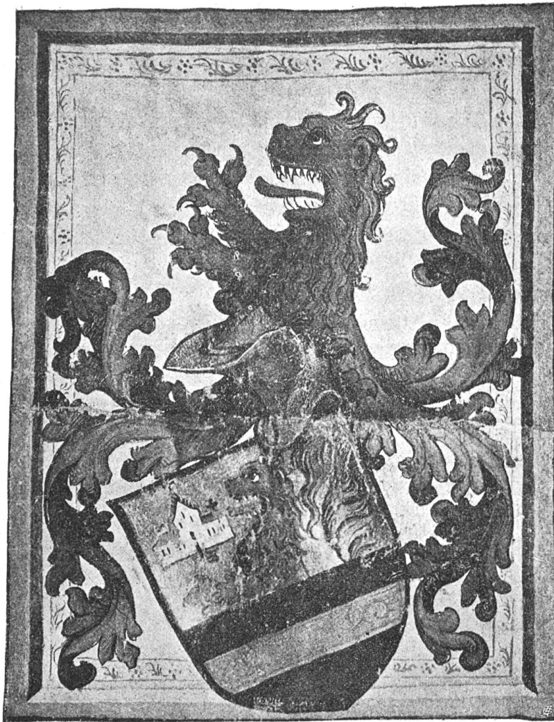
Fig. 47 Kilchman

auf dem Schilde einen Helm dorauf ein roter leo mit zwein aufgereckten tatzen und ausgereckter Zungen als in dem Schilde, mit einer swartzen und roten Helmdecke“.