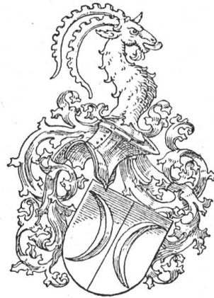
Fig. 49 v. Waltenheim (Zchg. Rochet).