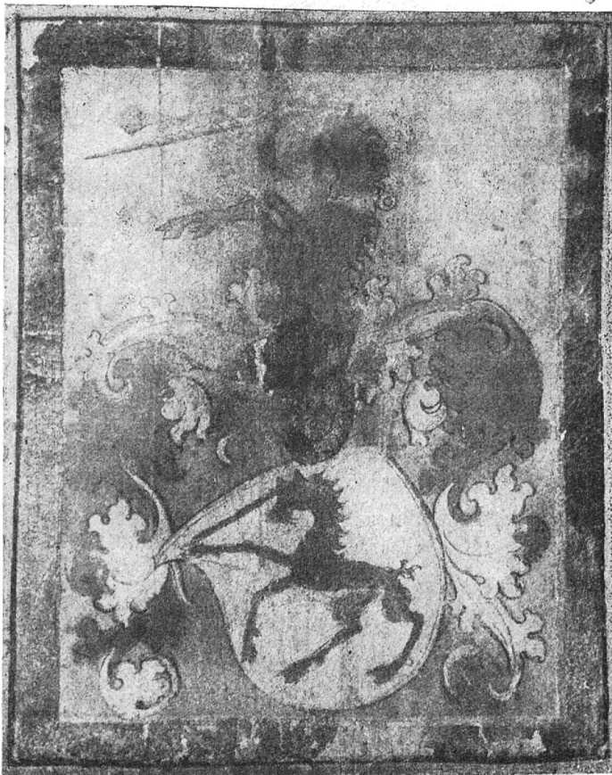
Fig. 62 David.

„mit namen sein einen schiltte in mitte ubertzwich gleich geteilt das unnder swartz darin in mitte ein rotte laisten unnd das oberteil weis oder Silberfarb darin ein vorderteil eines Rotten Leo mit seinen ausgerakhten fuessen gelben kloen aufgeworfen krumben swantz aufgetanem maul unnd ausgeslagner rotten gelfunde Zungen und auf dem Schiltt einen helm getzieret mit einer roten und swartzen helmdeckhen darauf auch ein vorderteil eines rotten leo mit ausgerakhten fuessen gelben Cloen aufgetanem maul unnd ausgeslagnen Zungen.“