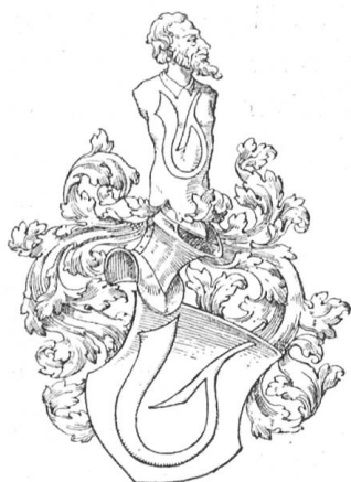
Fig. 24 (Zchg. Roschet)

Q: Familiengeschichte der Petri, Nürnberg 1913.