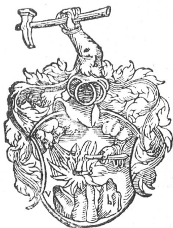
Fig. 23 (nach Wurstysen)

Petri in den Adelstand. Die Wappenbeschreibung im Diplom lautet: