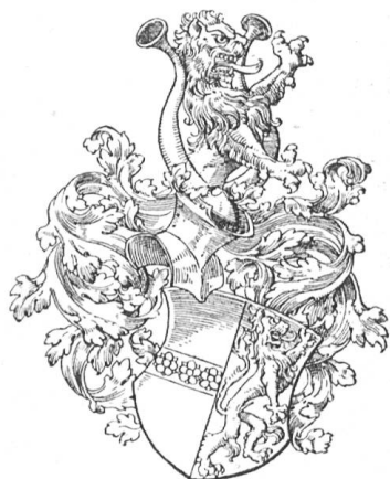
Fig. 26 (Zchg. Roschet)

Q: J. Kindler v. Knobloch, Die pfalzgräfl. Registratur d. Domprobstes W. Böcklin v. Böcklinsau, Z. f. d. G. d. O., Bd. VI, N. F., S. 278. — Chr. Wurstysen, Wappenbuch S. 173.