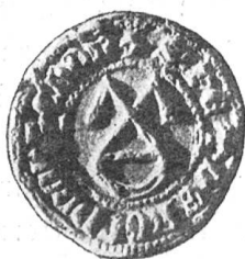
Fig. 38 ⚡ S' PET · DE · hOHDORF · C'DON 1330