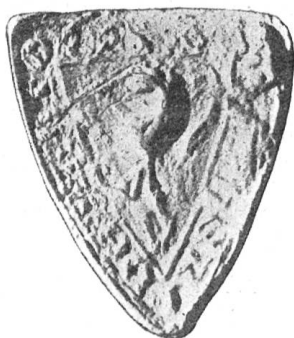
Fig. 36 ⚡ S · W ... ThERI · DE · hOHTORF 1231

Der Ort gab einem ursprünglich freien Geschlechte den Namen, dessen Sitz ein Turm mit hölzernem Wehrgang (wie Hohenrain) auf einer Terrainwelle nahe der Kirche stand und am Ende des 18. Jahrhunderts abgetragen wurde. Der bedeutendste Träger des Namens, Walther v. Hochdorf (Fig. 36), vergabte 1231 mit seiner Frau Berchta seine Güter zu Horw und im Moos bei Luzern an das dortige Kloster. Am 11. Januar 1233 ernannte ihn König Heinrich zum Schirmvogt über die Güter des Klosters Engelberg im Aargau. Er führte im Wappen einen Löwen wie die benachbarten Herren von Liele. Der 1231—1261 oft in Unterwalden und als Bürger von Luzern erscheinende, angesehene Johann „von Hildisrieden“, der sich aber im