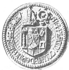
Fig. 64 Petit sceau de Mgr Colliard.

Placé à la tête d'un des plus grands diocèses de la Suisse, Mgr Colliard trouvera encore moins que jamais quelques instants de loisir à consacrer, à cette branche de prédilection. Néanmoins lorsque le nouvel évêque adopta le type officiel de ses armes et le modèle de son sceau il fit preuves de ses parfaites connaissances héraldiques.