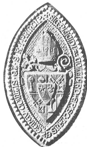
Fig. 63 Grand sceau de Mgr Colliard.

Les héraldistes suisses apprendront avec plaisir que Mgr Colliard cultive depuis longtemps avec passion, dans ses moments perdus, le « noble savoir ». Connu comme héraldiste, la Société d'histoire lui confia en 1902 le soin de rassembler et d'étudier les armoiries communales du Canton de Fribourg, mais à cause d'un surcroît de travail puis de son éloignement du Canton il dut renoncer à ces recherches et ce travail fut alors remis à l'auteur de ces lignes. Mgr Colliard a toujours suivi avec le plus vif intérêt les travaux de la Société suisse d'héraldique. Nous le comptons dès 1902 parmi les abonnés de nos Archives héraldiques suisses et en 1910 il se fait recevoir membre de notre société. Il espérait toujours reprendre une fois, lorsque le temps le lui permettrait, ses études de prédilection, mais sa paroisse l'absorbait de plus en plus et dans une lettre qu'il nous adressait en mai 1909 il évoquait « des projets amoureusement caressés autrefois et qu'il ne pourrait jamais exécuter », et nous parlant de sa grande paroisse du Locle, il ajoutait: « j'ai dû dire adieu à bien des choses et j'en suis réduit à suivre des yeux la marche des autres et à applaudir à leurs travaux en regrettant de n'y pouvoir prendre part ».