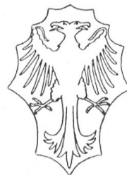
Fig. 142 Armoiries Magoria.

Magoria, de Bellinzone , porte: parti, d'argent et de gueules à l'aigle à deux têtes, de l'un à l'autre. Cimier: un buste de jeune fille de ... Armoiries gravées sur un bassin en granit du commencement du XVII e siècle au Musée de Bellinzone, avec l'inscription: STΔMA.; dans une banderolle la devise: Dilecta Amabilis et Pulcherim , qui se réfère probablement au buste (Fig. 143). Je renvoie aux Archives de 1905, p. 67, où j'ai donné le dessin de deux autres écussons aux armes de Magoria. Voici encore la reproduction de ces armes d'après une pierre sculptée du XVI e siècle, conservée au Musée de Bellinzone (Fig. 142).