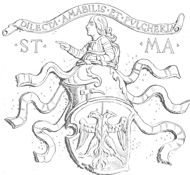
Fig. 143 Armoiries Magoria. Musée de Bellinzone.

Mandelli, de Bellinzone , porte: d'azur à trois lions passants de gueules. D'après une fresque du XVI e siècle à la maison Gedeschi à Giubiasco. Cette famille, originaire de Milan, s'établit à Bellinzone au XIV e siècle. Les deux archiprêtres Gioannolo et Petrolo da Mandello furent les principaux bienfaiteurs de la collégiale de San Pietro e Stefano à Bellinzone.