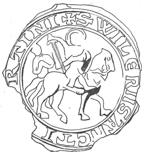
Fig. 19 Sceau de Guillaume de Saint Martin, Seigneur de Biolay, 1245.

de Biolay (Fig. 19), de petrus de Sancto Martino canonicus lausannensis (Fig. 20 et de Richardus dominus de Sancto Martino (Fig. 21). Le premier sceau est unique, croyons-nous, parmi les sceaux des dynastes romands, car il représente Saint Martin à cheval, partageant son manteau avec le pauvre. Le sceau de Pierre est intéressant par un autre côté: le faucon dévorant un oiseau qui s'y trouve, dévoile les goûts du chanoine chasseur. Celui de Richard enfin nous offre un écu à trois barres . M. Coulon a décrit dans son Inventaire des des Sceaux de la Bourgogne , No. 458, le sceau scutiforme de Richard (III), fils du précédent. Il se trouve aux Archives de la Côte-d'Or, (B 1232) attaché à une déclaration d'Uldric, frère du dit Richard, au sujet de son château de Châtillon super villam de Cronay , tenu en fief de Pierre de Savoie, datée d'avril 1255. L'écu arrondi montre trois pals .