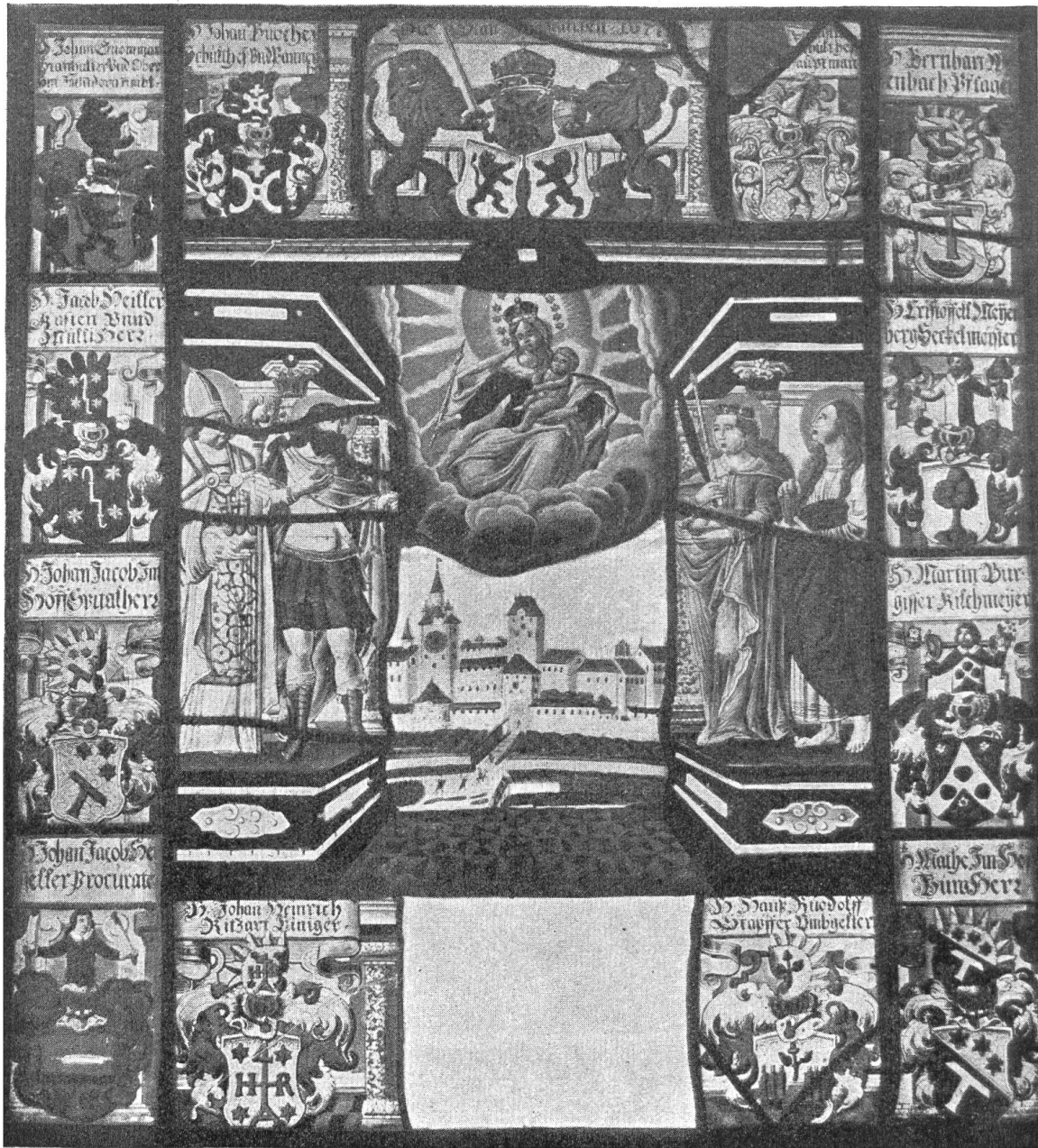
j i b g Fig. 17.

Ratsscheibe der Stadt Bremgarten (1677).