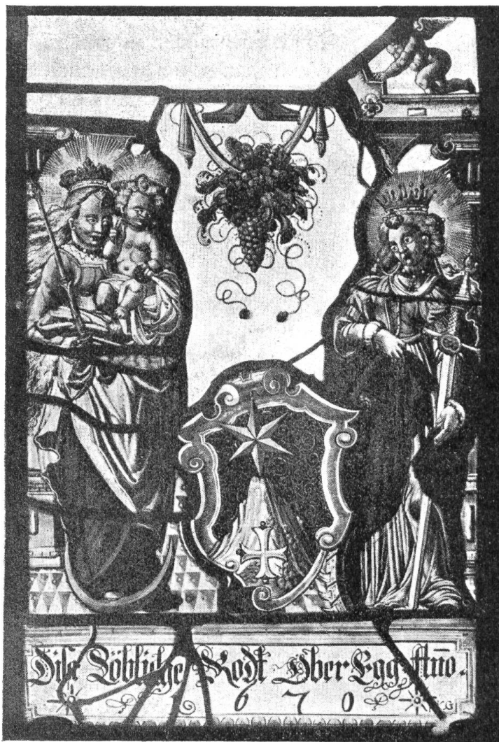
Fig. 111. Wappenscheibe der Rhode Oberegg. (Hist. Antiq. Sammlung Appenzell)

tapferer Wehr den Angriff Graf Friedrich's von Toggenburg abwehrten. Auf des Grafen Wappentier, den Hund, könnte der Spruch unter dem Rhodswappen Bezug haben :