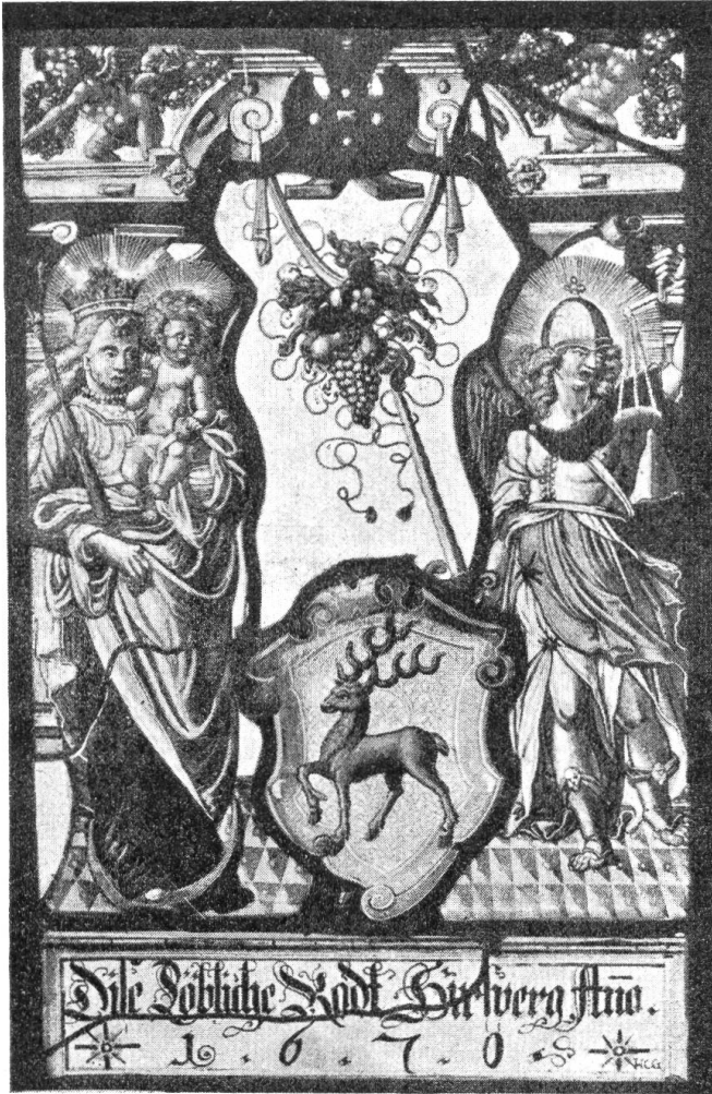
Fig. 109. Wappenscheibe der Rhode Hirschberg. (Hist. Antiq. Sammlung Appenzell).

Grundherren jener Gegend überein. Die eine Wappenvariante von Hirschberg, in Silber der rote Hirsch, würde in ihren Farbendenen von Rorschach-Rosenberg entsprechen, welch' letztere in Silber einen Rosenstock mit 5 roten Rosen führten. (Zürcher Wappenrolle 190). Die andere Variante bringt im blauen Feld den goldenen Hirsch. Diese Farben kommen im Wappen der Herren von Sulzberg vor, deren Schild von Blau und Gold im Wellenschnitte drei oder fünfmal geteilt war. (Zürcher Wappenrolle 60). Das Rundgemälde zeigt den roten Hirsch im weissen Feld (Fig. 110), die Wappenscheibe den goldfarbigen auf blauem Grunde (Fig. 109). Wenn der Hirsch als redende Wappenfigur erkannt wird, so wurde doch auf beiden Darstellungen auf einen Berg, als weiteren Hinweis auf den Namen Hirschberg, verzichtet. Der heraldisch unschöne grüne Schildfuss auf dem Rhodswappen des Rundgemäldes war wohl nur ein Notbehelf. Das Fähnlein der Rhode