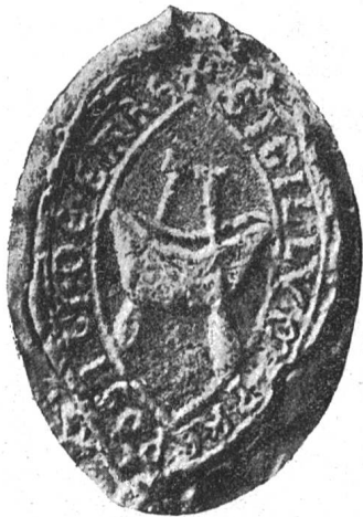
Fig. 51. Siegel des Propstes Ulrich (1243)

erscheint indessen erst am 24. März 1393 zum ersten Male. Es weist Maria mit dem Kind auf dem linken Arme, darunter das Wappen von Fahr: zwei gekreuzte Ruder, auf. Die Legende lautet S' CONVENTVS MONAST(er)II IN VARE (Fig. 52). Einsiedeln konnte eine solche Schmälerung seiner Rechte nicht hingehen lassen, denn mit dem Gebrauch des Siegels hatten die Frauen auch weitgehende Rechte in Bezug auf die äussere Verwaltung erhalten. Bereits 1396 scheinen die Frauen stillschweigend auf den Gebrauch eines eigenen Siegels verzichtet zu haben. Zwar erscheint das Siegel wiederum 1510, 1521 und 1522, ein Zeichen, dass das Kloster damals wieder ziemlich selbständiger Verwaltung sich erfreute. Zur Zeit