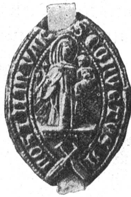
Fig. 52. Erstes Siegel des Klosters Fahr (1393)