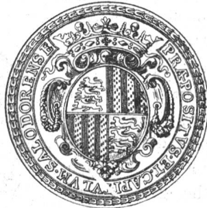
Fig. 76. Propst- und Kapitelsiegel von Solothurn. Ende des XVII. Jahrhunderts.