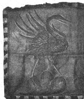
Fig. 143. Fanion de cavalerie du XVIII e siècle.