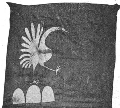
Fig. 142. Bannière de Gessenay du milieu du XVI e siècle.

le bec et les pattes jaunes, par contre nous trouvons ici les trois monts verts. Enfin signalons encore un petit fanion de cavalerie de 1702 à 1750 environ, dont la grue sur trois monts, est d'un très bon dessin (fig. 142).