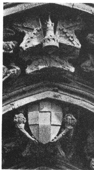
Fig. 150. - Armoiries du Pape Clément VII à l'église St-Maurice à Vienne, en Dauphiné.

Le musée Calvet conserve aussi une pierre carrée ornée des armes de Clément VII 2 . C'est un document intéressant pour l'histoire de l'héraldique ecclésiastique. L'écu aux cinq points équipolés est surmonté de deux clefs posées en