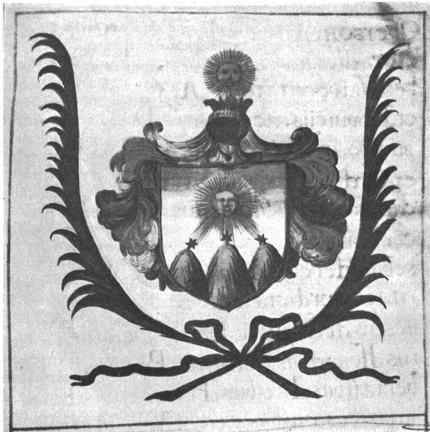
Fig. 154. Armoiries peintes sur le diplôme accordé à P. J. Oberson en 1688.

Aux études de philosophie succédèrent celles de théologie, car il embrassa l'état ecclésiastique : je le trouve, en 1691, vicaire à Givisiez 1 , mais il ne fit que passer en ce poste, puisqu'il y fut remplacé en cette même année par Antoine