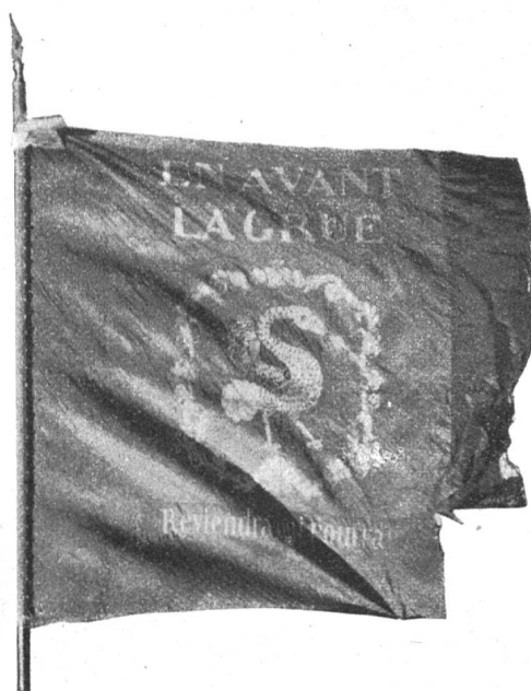
Fig. 176. Drapeau de Rougemont dit « la petite grue ».

Château d'Oex. Nous avons vu que cette localité formait avec Rossinière une châtelainie du comté de Gruyère. Le châtelain résidait à Château d'Oex où le comte possédait un château, situé sur une