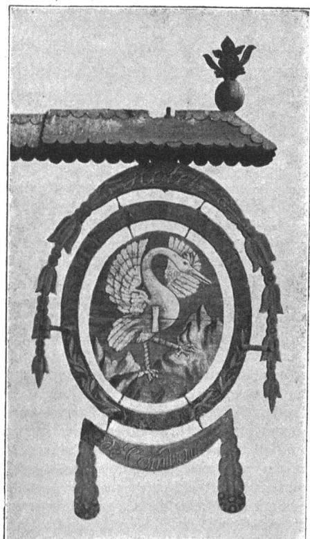
Fig. 178. Vieille enseigne de l'hôtel de commune de Rougemont.

Château d'Oex. Nous avons vu que cette localité formait avec Rossinière une châtelainie du comté de Gruyère. Le châtelain résidait à Château d'Oex où le comte possédait un château, situé sur une