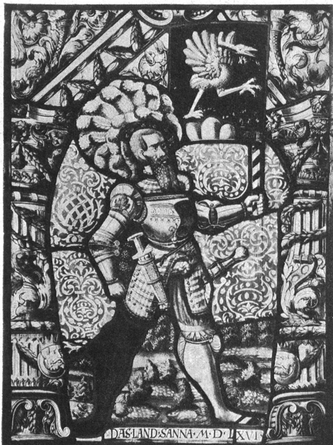
Fig. 169. Vitrail aux armes du Gessenay de 1566.

Il existe plusieurs beaux vitraux aux armes de Gessenay. Le plus ancien date