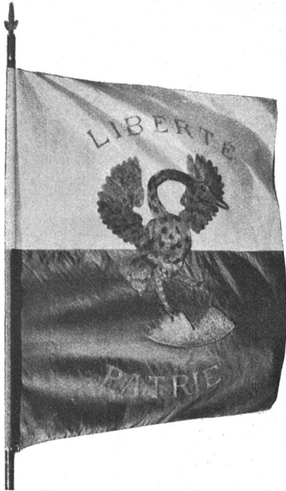
Fig. 175. Drapeau de Rougemont dit « la grande grue ».