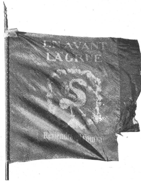
Fig. 176. Drapeau de Rougemont dit « la petite grue ».

Château d'Oex. Nous avons vu que cette localité formait avec Rossinière une châtelainie du comté de Gruyère. Le châtelain résidait à Château d'Oex où le comte possédait un château, situé sur une colline étroite et rocheuse, appelée aujourd'hui « château Cottier ».