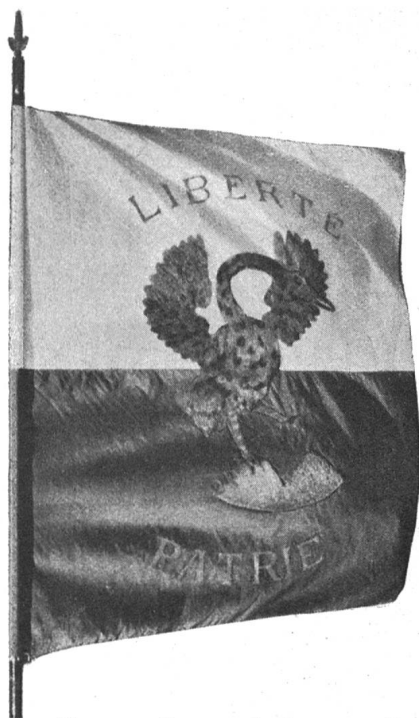
Fig. 175. Drapeau de Rougemont dit « la grande grue ».