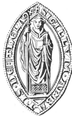
N° 139. Théla. 1294.