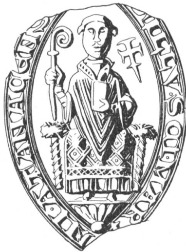
N° 133. Ainay. 1257.