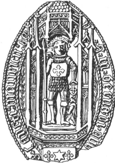
N° 123. Michel, abbé. 1440.