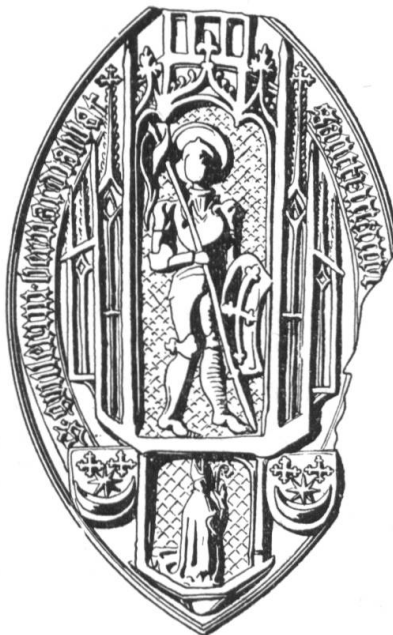
N° 125. Guillaume III, abbé. 1495.