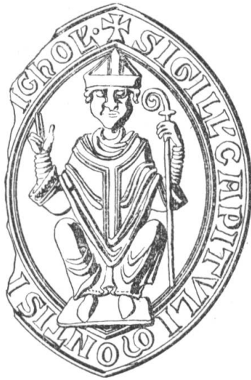
N° 143. Montjoux. 1444.