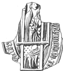
N° 148. Rota. 1438.