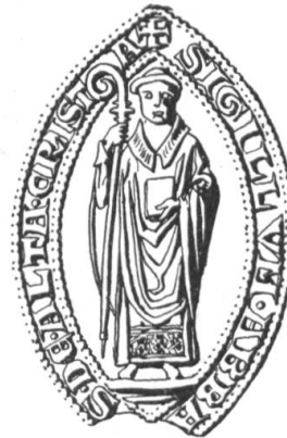
N° 137. Hautcrét. 1288.