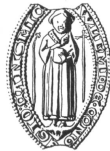
N° 129. Guillaume de Conthey, chanoine. 1276.