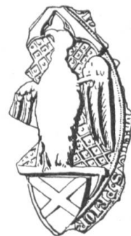
N° 144. Semur. 1326.