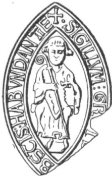
N° 131. Abondance. 1160.