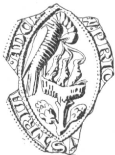
N° 142. Lutry. 1266.