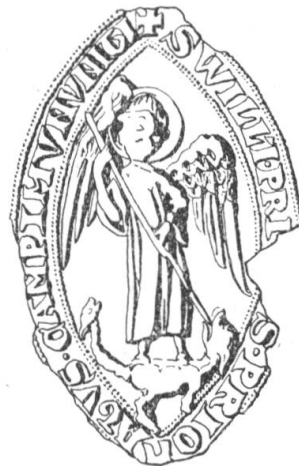
N° 140. Chamounix. 1307.