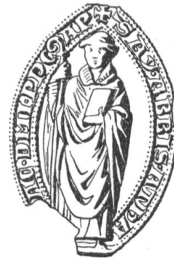
N° 134. Ainay. 1257.