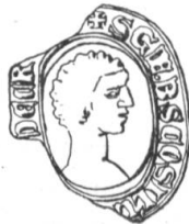
N° 215. Guillaume de Buonconsilio, contre-scel. 1292.