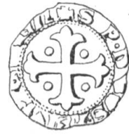
N° 198. Pierre, curé de Bagnes, 1296.