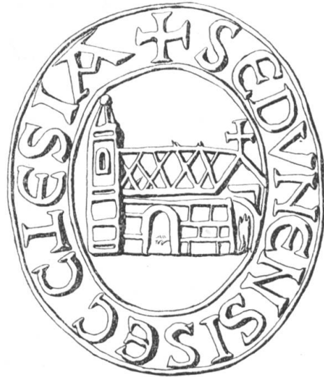
N° 187. Chapitre de Valère, 1189.