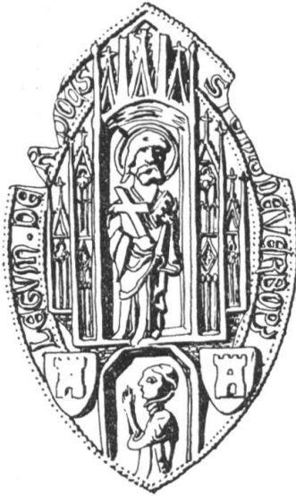
N° 218. Jean de Verbouz, doct. decret. 1365.