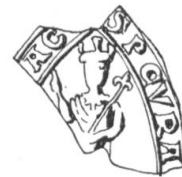
N° 208. Pierre, curé de St-Sigismond, 1280.