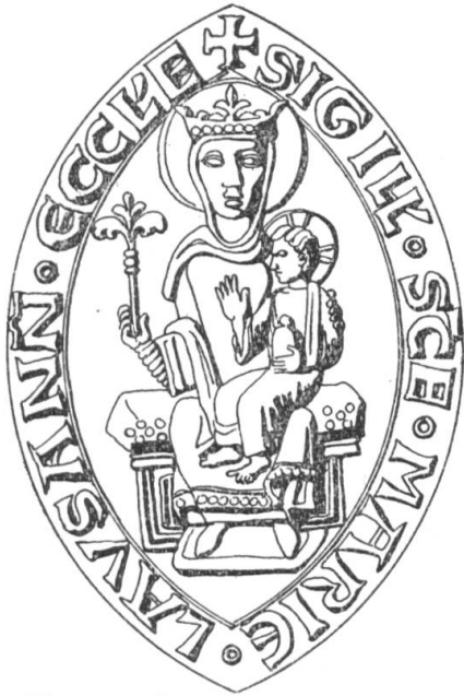
N° 186. Chapitre de Lausanne, 1180.