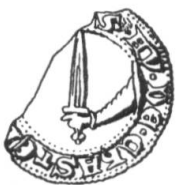
N° 227. Aymon de Châtillon, 1276.