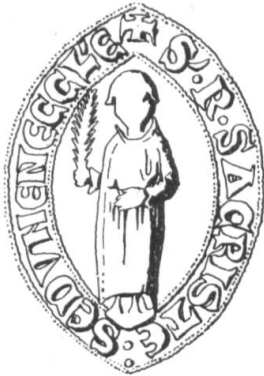
N° 189. Rodolphe, sacristain de Sion, 1214.