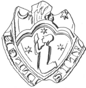
N° 196. Recteur de l'hôpital de Villeneuve, 1416.