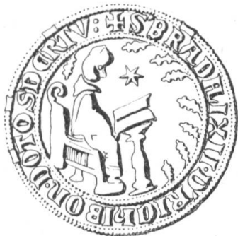
N° 216. Brandalisio de Richiboni, doct. decret. 1292.