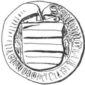
N° 219. Antoine de Villy, doct. decret. 1488.