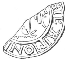
N° 190. Aymon, doyen de Sion, 1214.