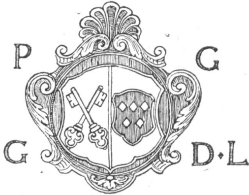
Fig. 68. Armoiries sur le sceptre de la Justice de Lugnorre, 1735.

L'historien Engelhardt nous apprend dans son histoire du district de Morat 1 que les armoiries de Lugnorre sont très anciennes et que, suivant la tradition, elles ont été concédées par les sires de Grandson.