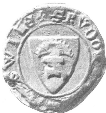
Fig. 110. Jkr Rudolf v. Roggliswil 1303.