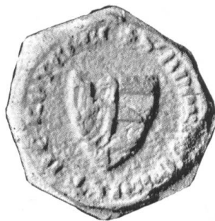
Fig. 115. Andreas v. Rothenburg 1346.