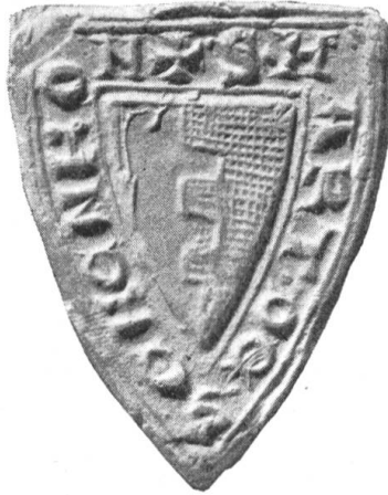
Fig. 128. Hartmann v. Schenkon 1299.