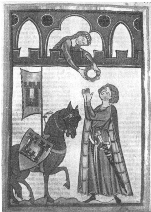
Fig. 113. Ritter Rudolf v. Rothenburg, Minnesänger (Manesse'sche Liederhandschrift).

10. Dienstmannen v. Rothenburg und v. Meggen v. Rothenburg (Alten-Meggen). — Nach den Freien erscheinen im Friedensvertrag zwischen den Vögten v. Rothenburg (Fig. 112) und dem Kloster Murbach-Luzern von 1257, nach dem Truchsessen Heinrich von Rothenburg, als Zeugen: „Rodolfus et Wernerus fratres de Rotenburc “ unter den Rittern. Ersterer ist identisch mit dem Minnesänger dieses Namens, welchem die Manessesche Liederhandschrift wohl irrtümlich, das Wappen der Freiherren v. Wolhusen gibt (Fig. 113). Dieser Familie gehören auch an, die Ritter Albrecht und Hugo (1282), Ulrich (1284—1303),