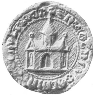
Fig. 105. Schultheiss Nikolaus v. Gundoldingen 1351.