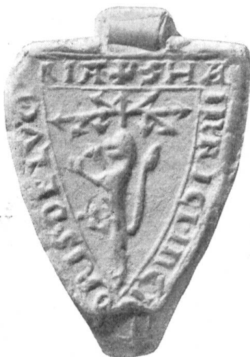
Fig. 124. Heinrich Sartor (Incisor, Cissor) 1252.