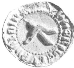
Fig. 104. Wernher v. Gundoldingen 1330.