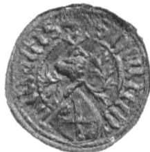
Fig. 102. a) Heinrich v. Malters 1451.