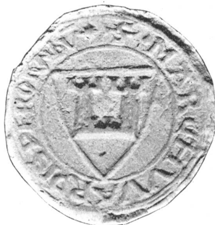
Fig. 112. Marquart Freiherr von Rothenburg 1252.

10. Dienstmannen v. Rothenburg und v. Meggen v. Rothenburg (Alten-Meggen). — Nach den Freien erscheinen im Friedensvertrag zwischen den Vögten v. Rothenburg (Fig. 112) und dem Kloster Murbach-Luzern von 1257, nach dem Truchsessen Heinrich von Rothenburg, als Zeugen: „Rodolfus et Wernerus fratres de Rotenburc “ unter den Rittern. Ersterer ist identisch mit dem Minnesänger dieses Namens, welchem die Manessesche Liederhandschrift wohl irrtümlich, das Wappen der Freiherren v. Wolhusen gibt (Fig. 113). Dieser Familie gehören auch an, die Ritter Albrecht und Hugo (1282), Ulrich (1284—1303),