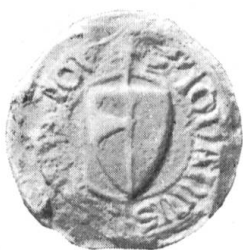
Fig. 125. Johann v. Obernau 1317.

Das Siegel Heinrichs Sartor (Incisor) von 1252 zeigt einen Löwen mit einem Busch auf dem Kopfe. Der Schild soll weiss, der Löwe rot, der Busch schwarz gewesen sein (Fig. 124).