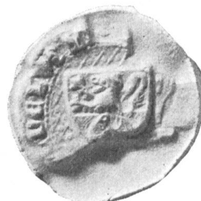
Fig. 126. Hartmann v. Obernau (Wappen v. Bramberg) 1344.

Die eingangs (Her. Arch. 1925, S. 131 u. Fig. 120-123) dargestellte Wappensippe , ist möglicherweise auf einen Ganerbenverband zurückzuführen, welchem Rudolf v. Schauensee angehörte, dessen Siegel seit 1282 in gelb ein schwarzes Zehnder-Geweih, dazwischen einen schw. Stern, zeigt (1925 S. 131). Dasselbe Wappen, jedoch weiss in rot, führten nachweislich seit 1297 (Fig. 123) die murbach-luzernischen Kellner von Sarnen (1143—1348). 1317 urkunden als Erben des Ritters