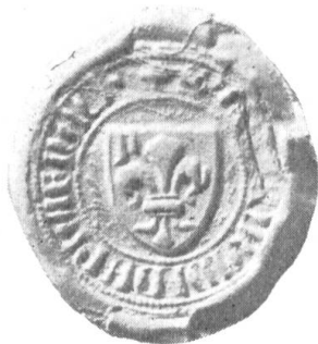
Fig. 111. Conrad v. Pfaffnach Spitalmeister-Zofingen 1391.