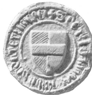
Fig. 106. Schultheiss Petermann v. Gundoldingen 1361.

9. Herren von Pfaffnach (Pfaffnau) und von Roggliswil. — Nachbar- burgen an der Nordwestgrenze des Kantons Luzern, vermischter Grundbesitz, gemeinsames Urwappen, alter Besitz im bernischen Seeland und froburgische Dienstmannschaft deuten auf Stammesgenossenschaft der Herren von Pfaffnach und von Roggliswil hin. Westschweizerischer Besitz ist für die Herren von Rogg- liswil seit 1256, für diejenigen von Pfaffnach 1270 bereits „ab antiquo“, nach- weisbar. 1276 verkaufte Mandgold von Thurn, gen. Gherenstein, der Propstei Frauenkappeln einen, offenbar eingehirateten Rebberg „que dicitur Fafenacho“ bei Ligerz.