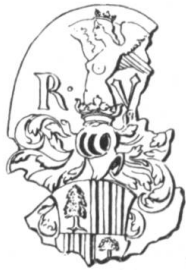
Fig. 135. Siegelzeichnung General Rudolf.

Der Wappenschild wird zwar im Diplom nicht beschrieben; doch ist er im Wappenbild geviertet: 1/4 in Gold der Salenbaum, 2/3 die sechs weiss-roten senkrechten Pfähle des Stammwappens. Zwei Helme: Helmzier rechts ein einfacher schwarzer gekrönter Reichsadler mit ausgespannten Flügeln und ausgespreizten Beinen, Helmdecken golden und schwarz; links die Salis'sche Jungfrau, Helmdecken rot und silbern (Fig. 133) 13) .