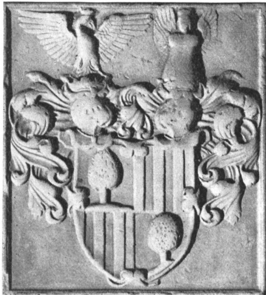
Fig. 134. Grabmal des Freiherrn Rudolf, † 1600. Basel, Münster.

Rudolf von Salis , geboren 1529, als der ältere Sohn des Obersten Herkules (1503—1578) zu Chiavenna und Soglio, diente zuerst in Frankreich in den Regimentern Unterhalden und Fröhlich; 1560 (13. und 16. Mai) schliessen der Vater und seine beiden Söhne Rudolf und Abundius eine Militär-Kapitulation mit Venedig für vier resp. sechs Jahre, ersterer als Oberst, letztere als Hauptleute; doch rückt Rudolf, da der Vater in Rücksicht auf sein Alter resigniert, schon am 1. Juni zum Obersten vor 9) . 1565 wird Rudolf wegen angeblich hochverrätherischer Verbindung mit Venedig, Spanien und dem Kaiser von den Engadineren gefangen genommen, nach Zuoz geschleppt und grausam gefoltert („bis uff den tod gestreckt“), schliesslich aber doch „als ein ehrlicher vom Adel“ ledig gelassen 10) . Im folgenden Jahre tritt Rudolf in die Dienste des Kaisers Maximilian II., seines besonderen Gönners, und wird gleich zum „Obersten Feldzeugmeister“ in Ungarn und Siebenbürgen bestellt und 1570, weil im Krieg lahm geschossen, mit