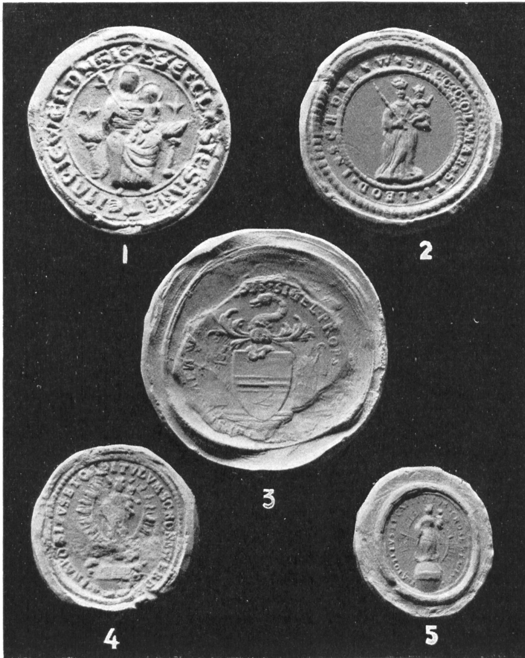
Fig. 143. Siegel des ehemaligen Kollegiatstiftes Schönwerd.

Die erste bekannte Urkunde erzählt uns, wie am 15. März 778 Bischof Remigius von Strassburg durch Testament das Benediktinerklösterlein Werd der Marienkirche und dem Domstifte dieser Stadt schenkweise übergab und unter den Schutz der Muttergottes Maria stellte.