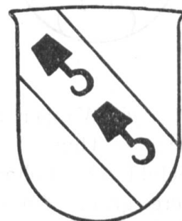
Fig. 42 (1813)

Nach 1813 ist alsdann das Führen von Familienwappen aus der Mode gekommen. Es mochte dies der Politik und dem Zeitgeist des letzten Jahrhunderts entsprechen. Erst jetzt fängt man wieder schüchtern an, da und dort Familienwappen anzubringen. Und gerade hier sollte für die Familienwappen von Thun das Wappendekret und das nach heraldischen Grundsätzen angelegte Wappenbuch von 1813 massgebend sein, denn das ist das einzige Dokument, auf das sich die bürgerlichen Wappen von Thun stützen.