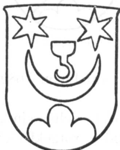
Fig. 41 (1768)