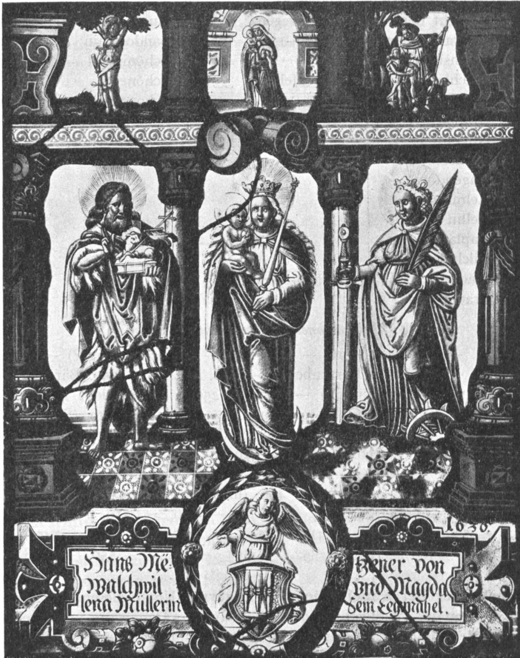
Fig. 46. Scheibe des Hans Metzner von Walchwil 1636.

fusionen führen kann. Schon bei der Restauration von 1742 wurde, löblicherweise, ein Genealoge beigezogen und dies sollte in Zukunft wieder gemacht werden. Ebenso ist zu wünschen, dass inskünftig die beiden Serien Schweizergeschichte und Heiligenlegende einmal vollständig veröffentlicht werden.