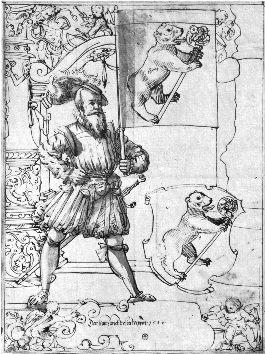
Carton de vitrail aux armes de St.-Ursanne, 1585