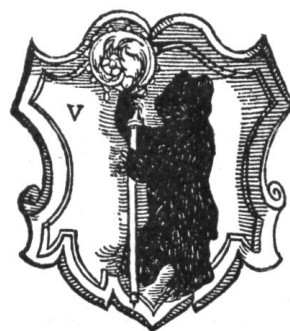
Fig. 203. Armes de St-Ursanne d'après Wurstisen.

Les armoiries de la petite ville de St. Ursanne sont: d'argent à l'ours de sable tenant une crosse d'or . Les émaux sont ceux de la ville de Bâle qui se retrouvent encore dans les armes de l'abbaye de Bellelay et des villes de Porrentruy, Laufon et d'autres. Un sceau de la ville de St. Ursanne du XVIIIe siècle nous montre l'ours de sable posé sur un champ parti d'argent et de gueules, soit les émaux de l'évêché de Bâle. On trouve aussi parfois l'ours posé en bande comme nous le voyons sur le beau carton de vitrail que nous reproduisons ici. Il est daté de 1585 et fait partie des collections du Cabinet des estampes de Bâle (Planche V). A côté des armes de la ville se carre un beau banneret tenant une bannière dont la partie supérieure est occupée par un chef rouge qui rappelle par sa couleur la banderole qui ornait la bannière de Zurich et par ses dimensions celles de Glaris et de Bâle. Cette dernière fut coupée solennellement sur le champ de bataille de Morat par le duc de Lorraine.