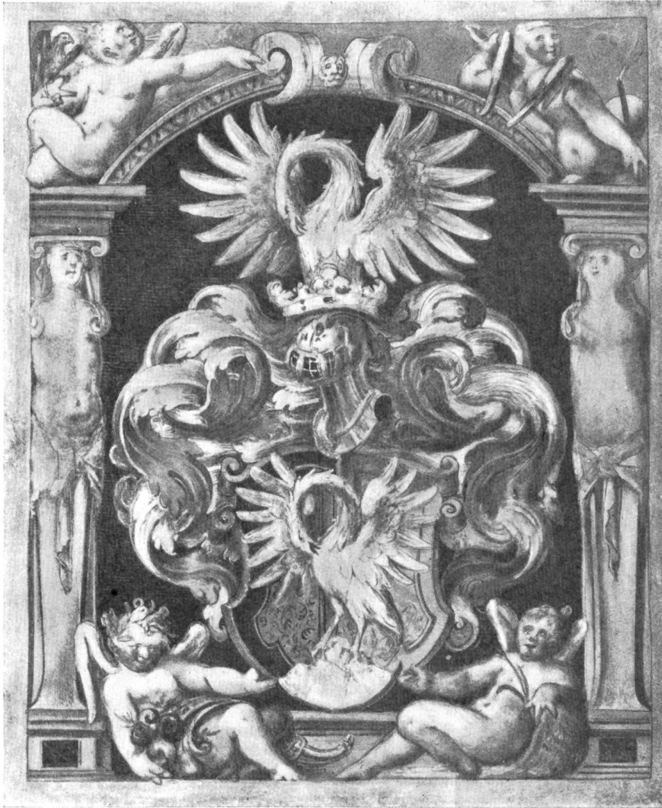
Fig. 205. Armoiries peintes sur le diplôme accordé à Quentin Couvreu en 1590.

Hinc est quod cum fide digna multorum relatione acceperimus te supra dictum Quintinum Couvreu non modo bonis ac iis parentibus ortum esse qui de divis antecessoribus nostris Romanorum Imperatoribus et Regibus ipsoque Sacro Romano Imperio quavis occasione praeclare mereri studuerunt, verum etiam iis cum ingenii tum fortunae dotibus