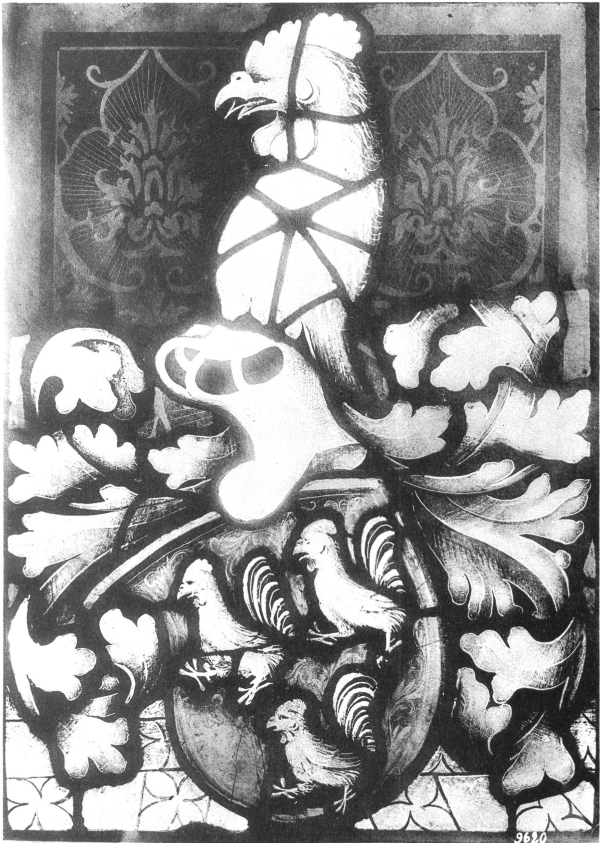
Jacquette Ryche († 1470).