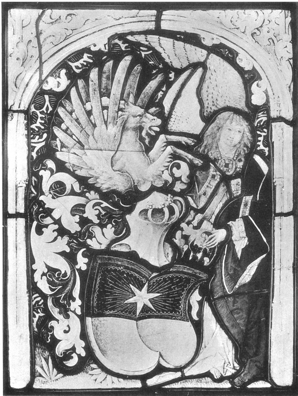
Freiherren von Heven. ca. 1500.