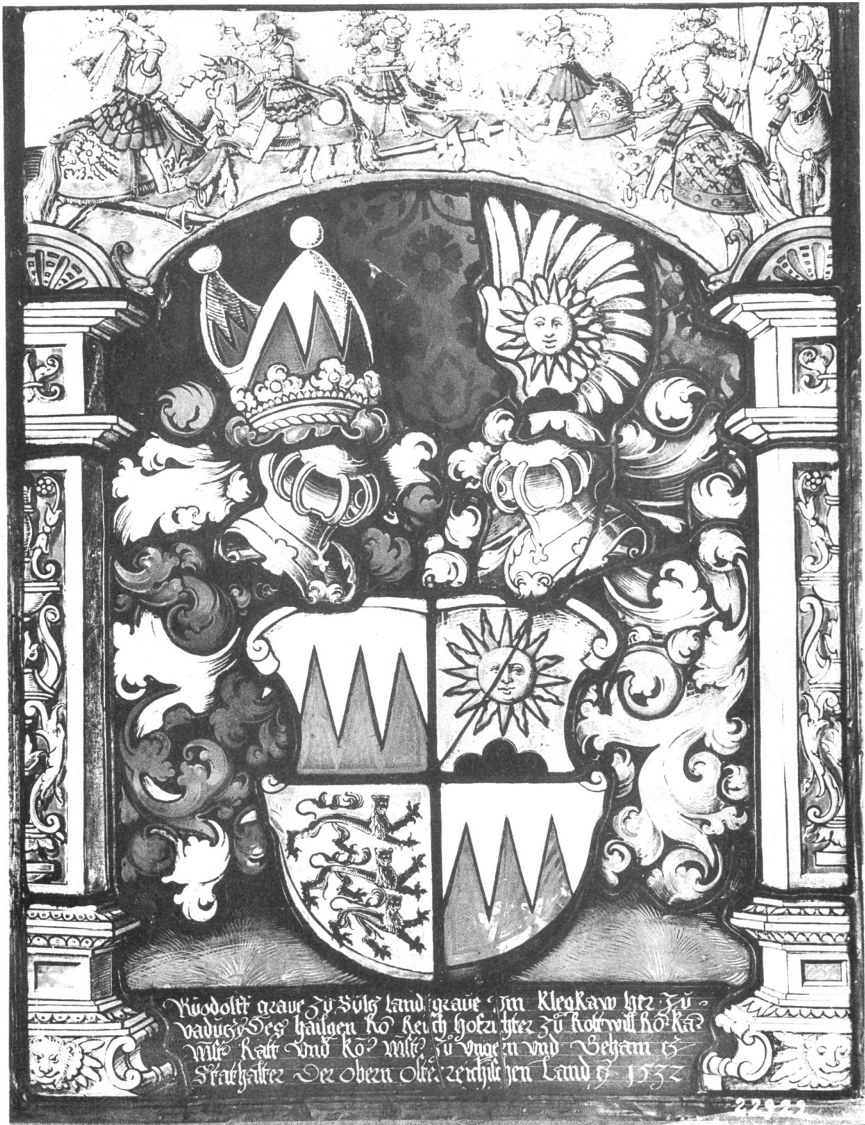
Rudolf, Graf von Sulz. 1532.