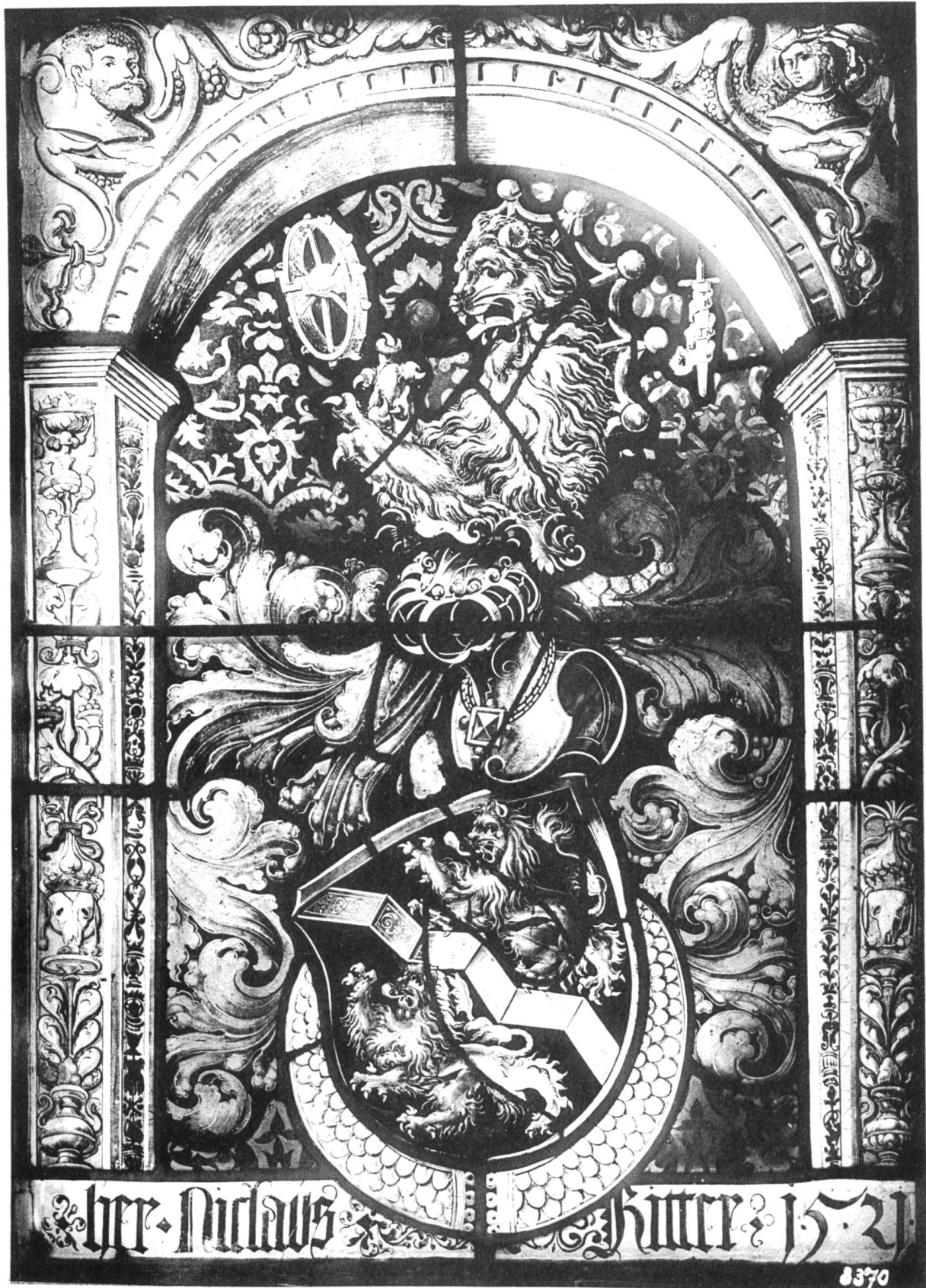
Nikolaus von Diesbach. 1521.