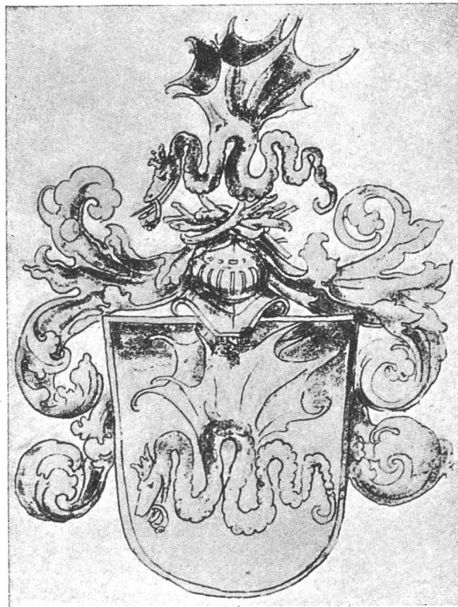
Fig. 169. Wappen, verliehen von Kurfürst Friedrich III. an den Maler-Apotheker Lukas Cranach.

kischen Städtchen Kranach Geborene ward 1504 Hofmaler des Kurfürsten Friedrich III. von Sachsen. Cranach muss schon zu dieser Zeit Apotheker gewesen sein, wenn auch die Urkunde, welche als Beleg gilt, 16 Jahre jünger ist. Im Jahre 1520 nämlich erwirbt der Genannte die Apotheke in Wittenberg käuflich und führt sie persönlich. Noch heute befindet sich im Lukas Cranachhaus die Adlerapotheke. Erst im vorgerückten Alter, als er zum Bürgermeister von Wittenberg gewählt worden war, liess der Malerapotheker seine Offizin durch einen Schwiegersohn Kasparus Pfrund verwalten 1) . Mehr ist über die Tätigkeit Cranachs als Apotheker nicht auf uns gekommen. Sie ist als ursprüngliche neben einem zweiten Beruf