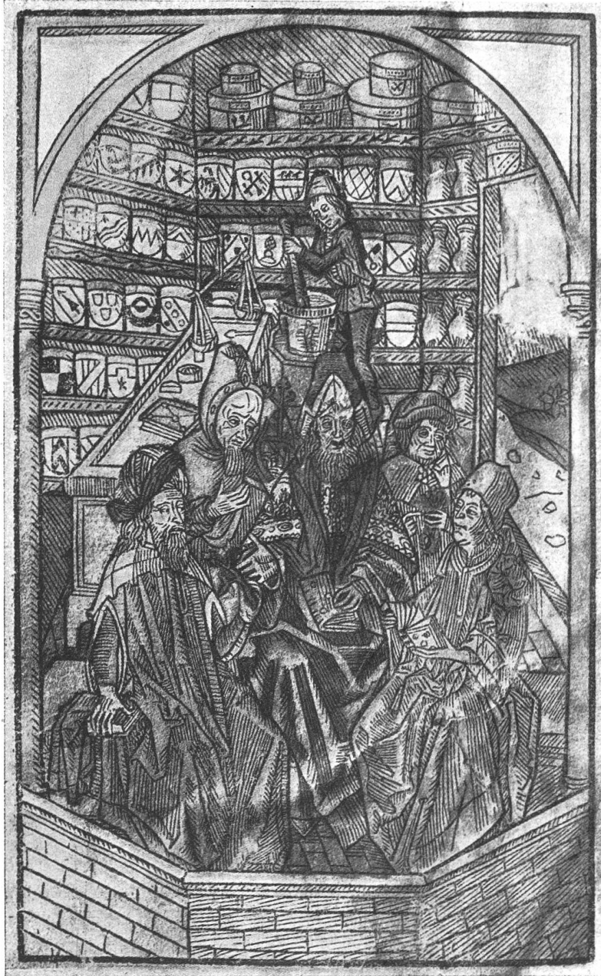
Fig. 173. Versammlung von Gelehrten der Arzneikunde in einer mittelalterlichen Apotheke. Handbemalter Holzschnitt aus der Inkunabel Hortus Sanitatis aus dem Jahr 1488.

Sachsen und Strigau trug beispielsweise das betreffende Stadt- oder Länderwappen. Die Herkunft aus Florenz ist durch eine stilisierte Lilie und das Mediceerwappen gekennzeichnet. Malta prägte seiner Terra sigillata das Kreuz seines Ritterordens auf oder den mit allen Zutaten begleiteten Schild seines Grossmeisters. Diese Insignien