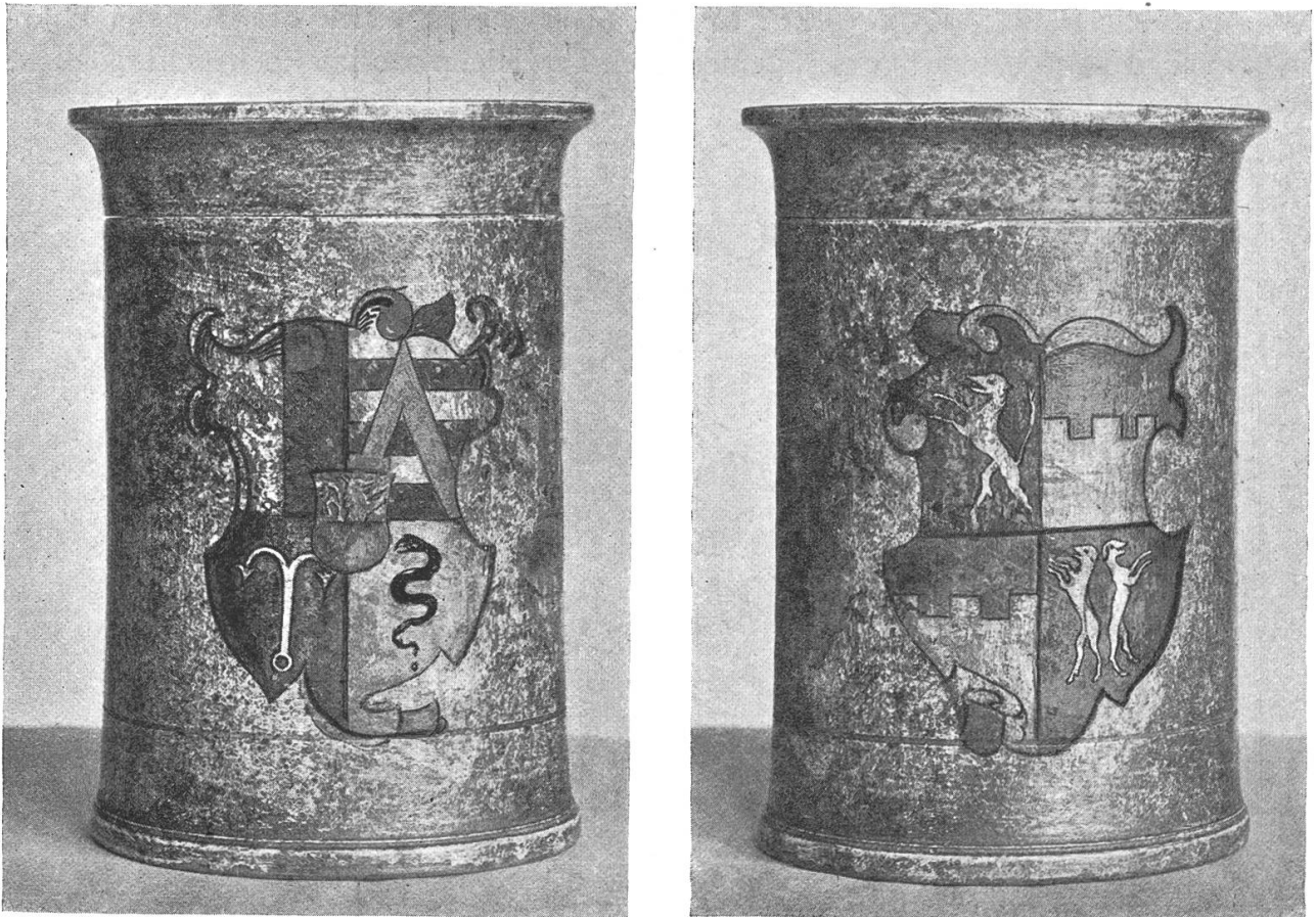
Fig. 175 u. 176. Gedrehte Holzbüchse mit Doppelwappen, 16. Jahrh. (Um dasselbe zur Darstellung zu bringen waren von ein und demselben Objekt zwei photographische Aufnahmen notwendig.)

1500 (Fig. 174), das Titelblatt einer theologischen Streitschrift des Ulrich Bossler von Hassfurt aus dem Jahre 1521 1) und andere Destillier-Kräuter- und Apothekerbücher um diese Zeit bringen Abbildungen, welche die Einrichtung damaliger Apotheken zeigen. Aus diesen Darstellungen erhellt, dass, dem Beschauer zugewendet, der Inhalt der Holzschachteln und -büchsen sowie der Töpfe nicht durch Beschriftung angegeben war, sondern vermitteltst Aufmalung von Wappenschildern verschiedenster Art. Da deren zeichnerische Durchführung heraldischer Prüfung stand hält, darf angenommen werden, dass es sich nicht nur um dekorative Phantasie-