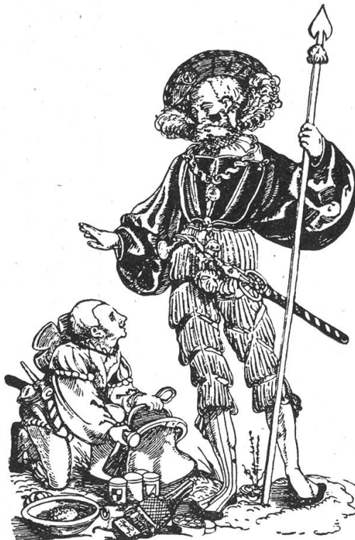
Fig. 177. Feldarzt des 16. Jahrh. mit heraldisch bezeichneten Salbenbüchsen.

Demnach dürfte neben der heraldischen noch eine zweite buchstabenchriftliche Inhaltsbezeichnung bei dieser Art Gefässe vorhanden gewesen sein. Die Gepflogenheit, Töpfe und andere Apothekengefässe mit Anbindesignaturen zu versehen, oder den Inhalt auf dem Verschlussmaterial (Tierhaut, Leder, Pergament, Papier) anzugeben, ist überdies der Bezeichnung mittelst aufgemalter oder eingebrannter Schrift vor- und nebenläufig. Eine restlose Lösung dieser heraldischen Frage in der Pharmazie scheint zur Stunde mangels genügenden Vergleichmaterials noch nicht möglich.