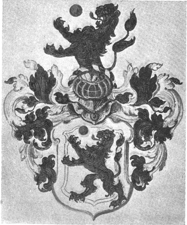
Fig. 171. Socin.

Peters 2) gibt diesem Schildbild die Auslegung, die geflügelte Schlange sei eine Vereinigung der Schlange Äskulaps mit den Flügeln des Pegasus, das Ganze sei eine Anspielung auf die zusammengestellte Arznei- und Malkunst des Briefempfängers. Wem der Vergleich der häutigen Fledermausflügel mit den Federschwingen des Dichterhengstes zu gewagt erscheint, was ich annehme, der mag in der geflügelten Schlange einen Drachen erblicken. Auch in diesem Falle bleibt die Anspielung auf den Apothekerberuf vollauf bestehen. Der Drache lieferte wie die Schlange eine offizinelle Droge, das rote Drachenblut, welches erst die Wissenschaft der neuern Zeit als nicht von tierischer, sondern von pflanzlicher Herkunft, als gefärbtes Harz indischer Palmenarten erkannt hat. Das Ringlein mit dem Rubinstein aber scheint eine Hindeutung auf die Edelsteintherapie zu sein: die Edelsteine haben bis tief in das 18. Jahrhundert hinein als Medikament gegolten bei innerlicher und äusserlicher Anwendung. Man nahm sie gepulvert ein in Pillen- und Latwergenform oder trug sie als Anhängemedikamente, als Amulette an Leib und Gliedern. Der Rubin galt als geschätzter Talisman, der vor Vergiftungs-