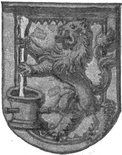
Fig. 170. Clauser.

„Ein gelen schylt, darinnen ein swartz Slangenn habend, in der myth zwen swartz Fledermeus-Flugel, auf dem Heubt ein Rote Cron vnnd in dem mund ein gulden ringleyn, darinnen ein Rubinsteinlein vnnd auf dem Schylde ein helm mit einer Swartzen vnnd gelen helmdecken vnnd auff dem helm ein gelen pausch von dornen gewunden, darauf aber ein slangen ist zu gleichermas im Schylde wie dann das in mytten dits briefs aygentlicher gemahlt vnnd mit farben ausgestrichen ist“ 1) (Fig. 169).