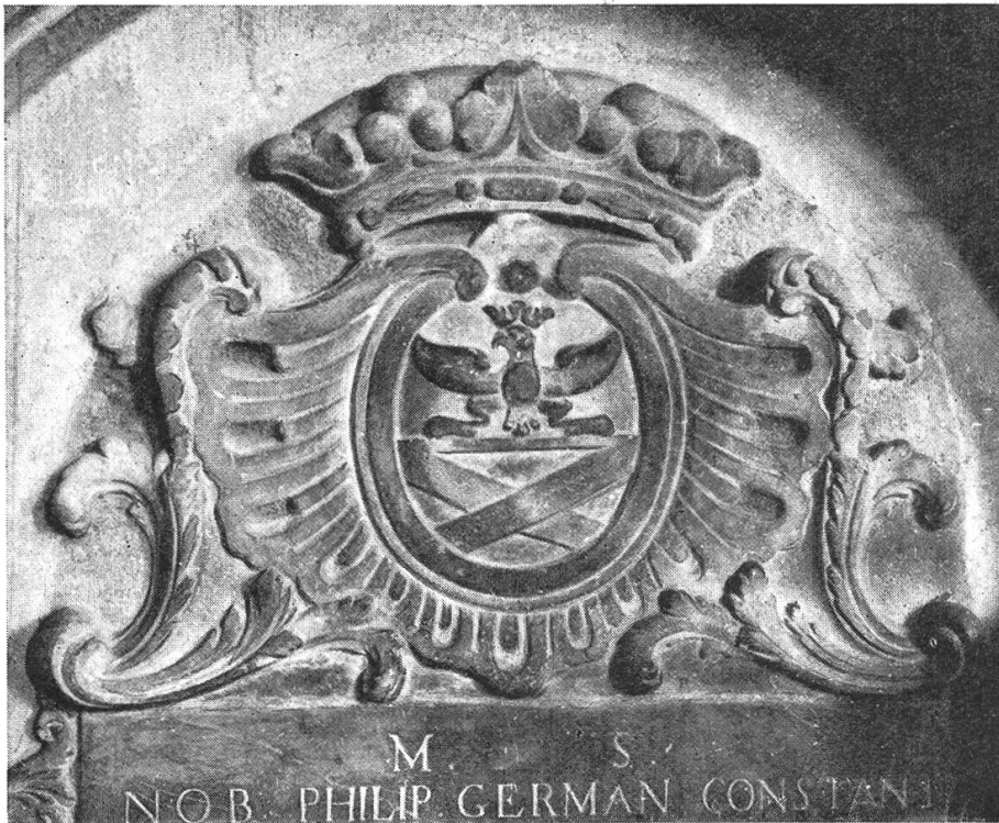
Fig. 216. Armoiries de Ph. G. Constant de Rebecque, 1756.

La pierre tombale suivante est consacrée à Philippe-Germain Constant de Rebecque. Ses armes dans un cartouche de style Louis XV sont surmontées d'une