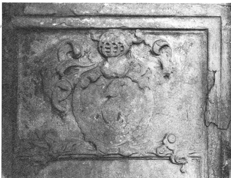
Fig. 214. Armoiries de David Steiger, 1704.

armoiries, soit: de gueules à la colombe d'argent , surmontées d'une couronne à neuf perles, d'où sort un griffon comme cimier. Ces armes ont aussi deux griffons comme supports (fig. 213).