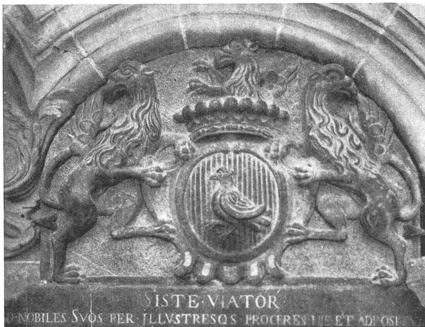
Fig. 213. Armoiries de Jean-Pierre de Crousaz, 1750.

La famille de Goumoens avait d'étroites relations avec la cathédrale de Lausanne, dans laquelle elle avait fondé la chapelle de St-Eustache. Elle a donné aussi, du XIII e au XVI e siècle, plus de sept chanoines à la cathédrale 1) , soit: Henri, avant 1143; Girold, avant 1227; Guillaume, 1233—1289;