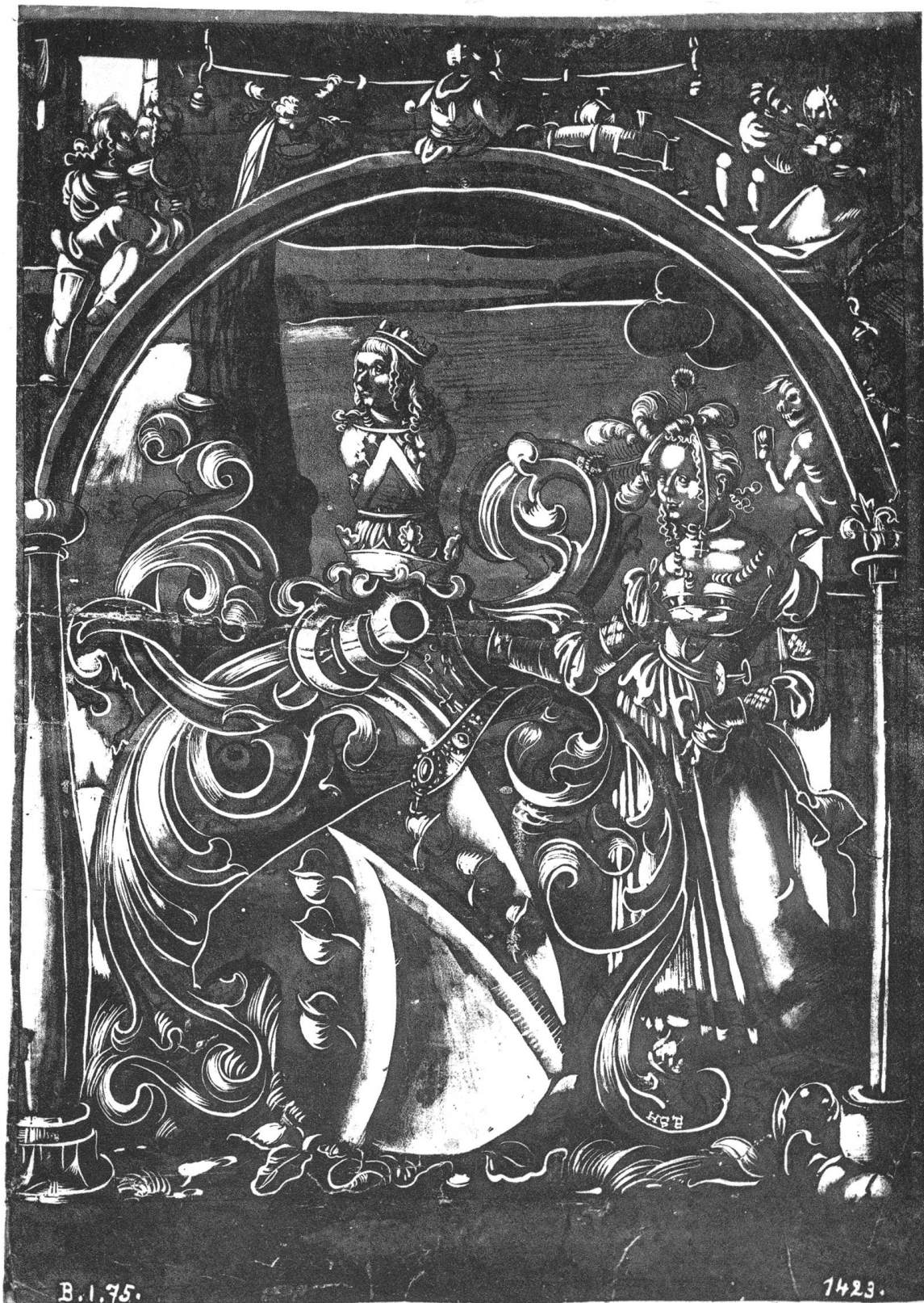
Unbekanntes Wappen. Ca 1515.