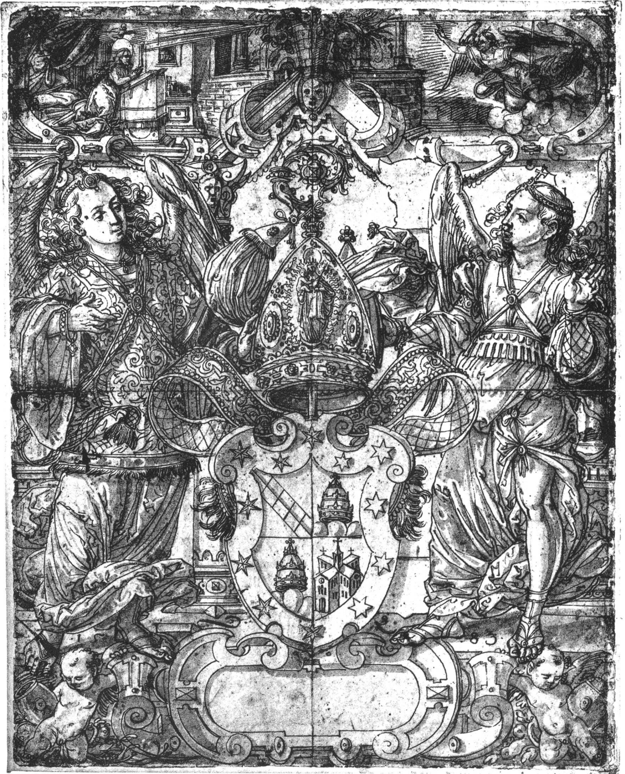
Beat Papst, & Abt von Lützel 1583.