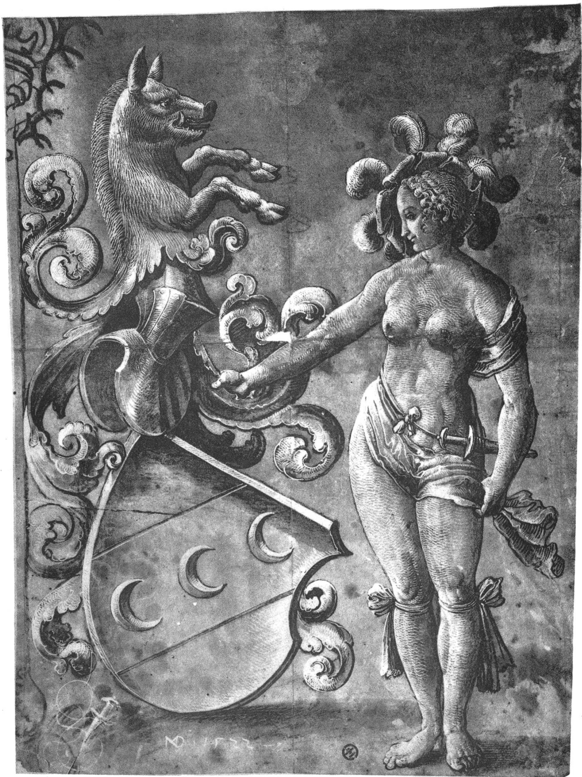
Wappen der Herren von Goldenberg (Zürich) 1522.