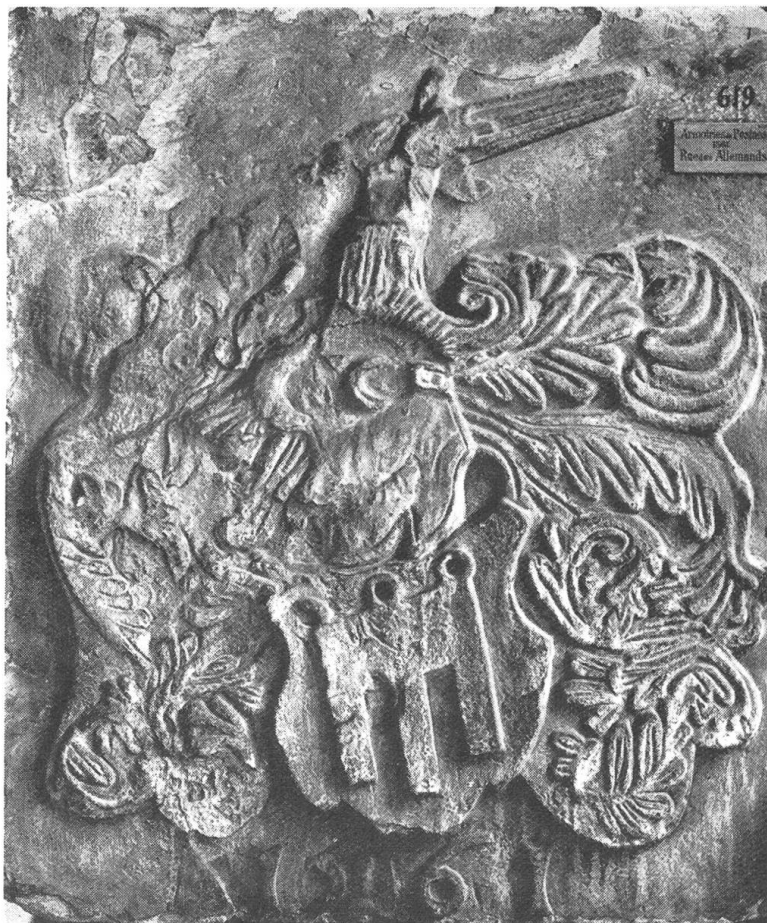
Fig. 4. Armoiries de Pesmes sur la maison de cette famille à Genève, rue des Allemands No. 30 (actuellement au musée).

Leur fils, Jaques de Montmayeur, gouverneur de Montmélian, vendit le 20 octobre 1603 (Panchaud, notaire à Ballens) le fief de Brandis situé à Cologny, à Noble Pierre Testu, citoyen de Genève, pour mille ducats, et le 20 décembre 1607, Berne lui acheta les terres et le château de Brandis dans l'Emmenthal pour 10.000 couronnes soleil et 300 couronnes d'épingles. La seigneurie fut transformée