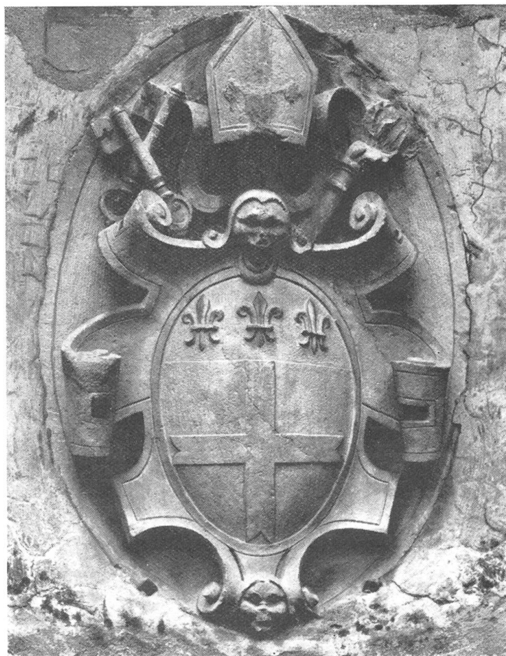
Fig. 7. Armoiries de Bernardino Della Croce, évêque de Côme en 1565.

I. II. IV. Della Croce de Riva San Vitale . Une pierre aux armes de Bernardino Della Croce, évêque de Côme, décédé en 1565, a été trouvée enterrée