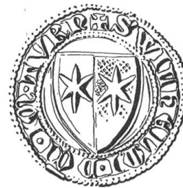
Fig. 119. Guillaume, dit Im Turm.

prit le nom d' im Turm , d'après sa tour au marché du sel. Un domicellus willelmus inturn est tombé à Sempach, serait-ce notre Willem van Thoery? Il se peut, car oe en néerlandais se prononçant ou , van Thoery n'est donc pas très différent d'im Turm. Il y a d'ailleurs plusieurs Willelm im Turm à cette époque qui scelent tous avec les armes Brümsi, soit avec l'écu seul (fig. 119) 1) soit avec l'écu et le cimier que porte notre Willem, sauf que