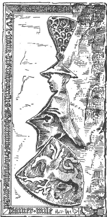
Fig. 123. Pierre tombale de Frédéric de Greiffenstein, à Königsfelden.