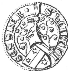
Fig. 124. Henri Gessler.