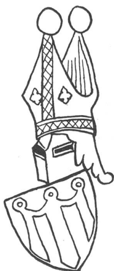
Fig. 126. Le comte de Montfort.

Au preux Léopold lui-même « d' h'toge va' oosterijc », qui paraît quelques pages plus loin, Gelre donne les armes d'Autriche simples 2) (fig.127), laissant de côté les autres blasons dont le duc orne son magnifique sceau équestre (Planche VI) 3) , où les armes de la Styrie, la panthère fabuleuse se voit sur la bannière et sur les caparaçons, qui portent en plus des écus de Carinthie et du Tyrol 4) . La bannière est munie d'un fanon; ce sceau est donc un des tout premiers exemples de cette adjonction décorative, qu'un préjugé probablement invincible persiste à considérer comme le symbole d'une défaite. C'est peu connaître les gens du moyen âge que de les