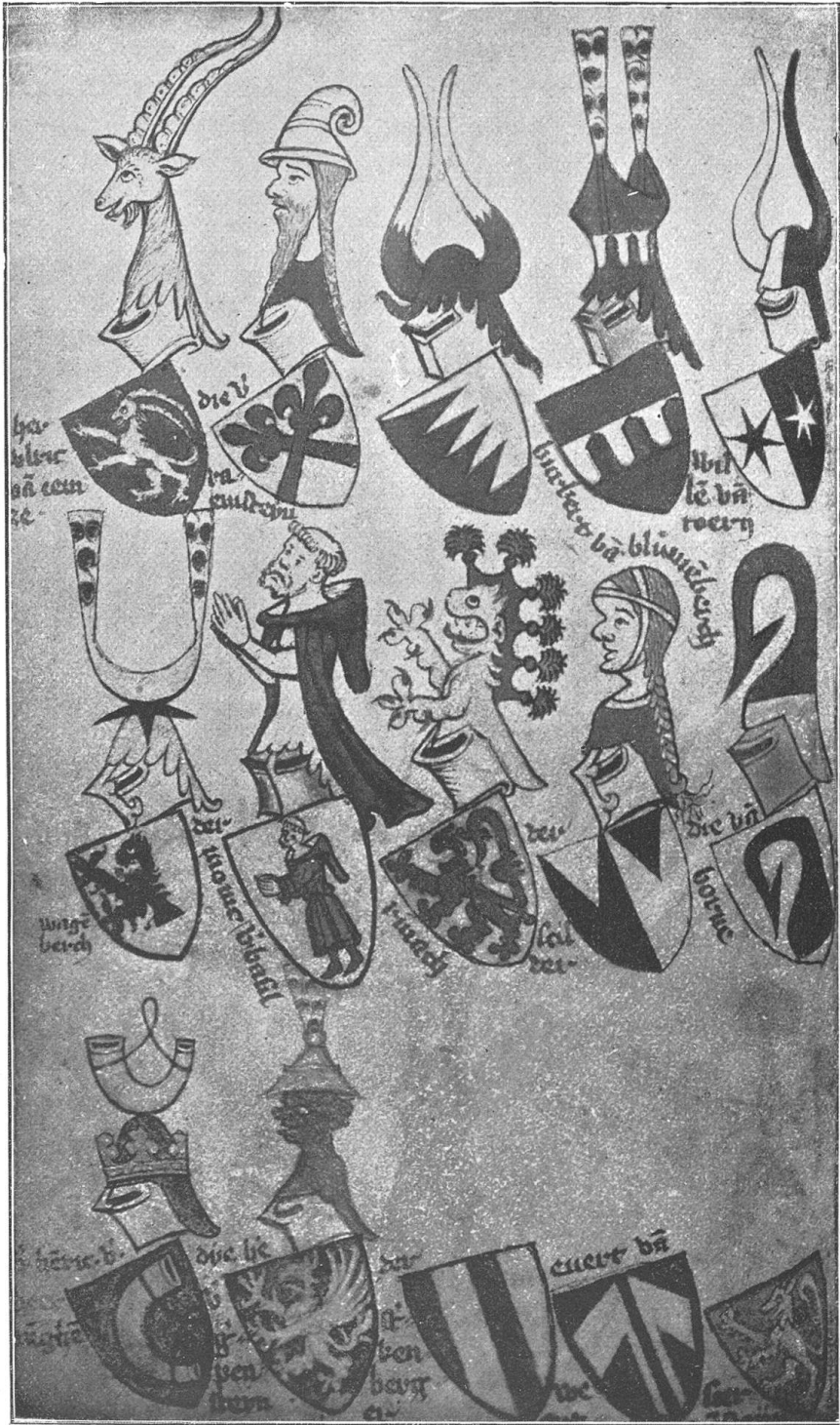
Armorial de Gelre.