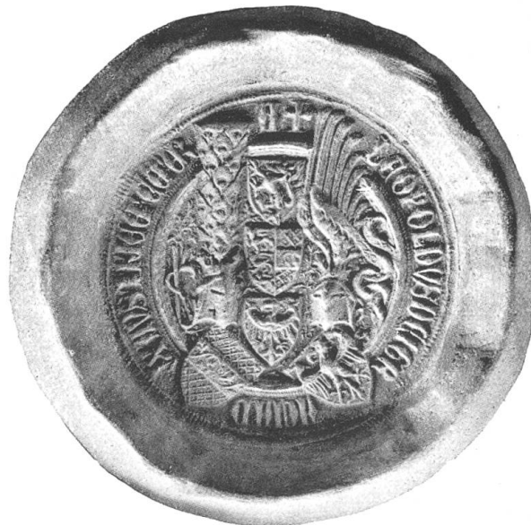
Sceaux du duc Leopold III d'Autriche. 1369, 25 octobre et 1379, 13 janvier.