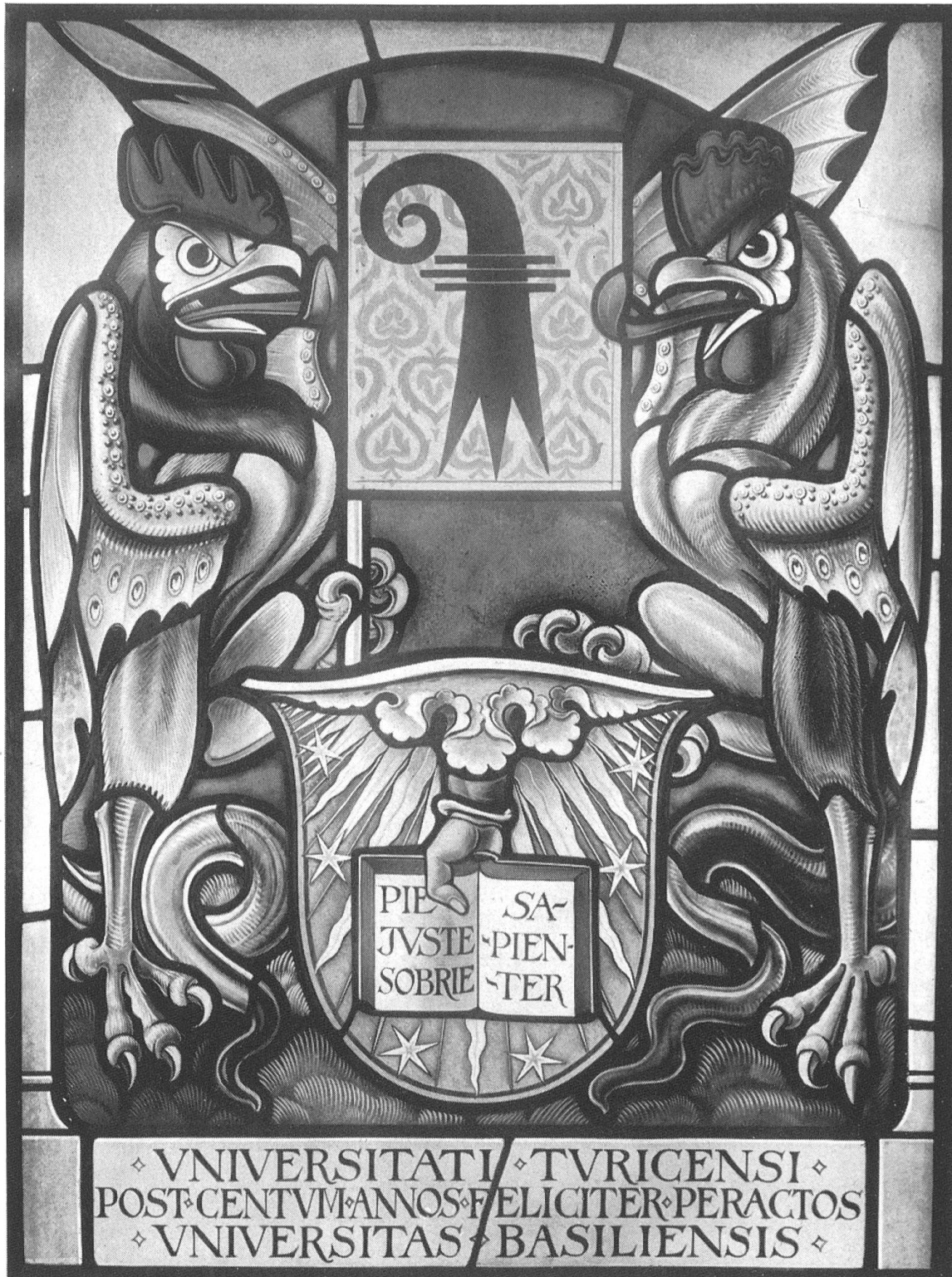
Die Wappenscheibe der Basler Hochschule.