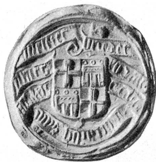
Fig. 89. Rudolf X. Graf von Werdenberg, Grossbailli von Brandenburg u. Oberster Meister in Deutschen Landen 1481—1505 (Landesmuseum).

Unsere Landesgeschichte verzeichnet mehrere Konflikte des Ordens; so lag die Komthurei Hohenrain 1315 im Kriege mit dem Kollegiatstift Beromünster und dessen Kastvogt Herzog Leopold v. Österreich und wieder mit ersterem 1459—1466 im kanonischen Prozess 2) .