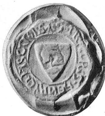
Fig. 90. Br. Heinrich Piscator Komthur zu Buchsee 1257 VIII 23./XI 9 (StA Bern, F. Fraubrunnen).