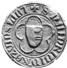
Nr. 15 Siegel von Nr. 27 2 des Textes (Heinrich V.)