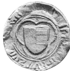
Nr. 14 Siegel von Nr. 27 1 des Textes (Heinrich V.)