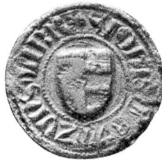
Nr. 13 Siegel von Nr. 26 4 des Textes (Johannes)