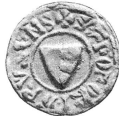
Nr. 3 Siegel von Nr. 15 a des Textes (Christoffel)