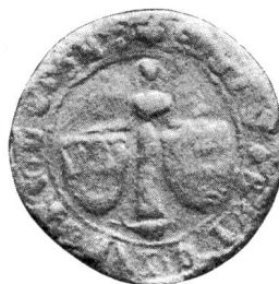
Nr. 8 Siegel von Nr. 22 des Textes (Elisabeth)