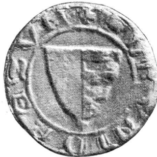
Nr. 5 Siegel von Nr. 12 des Textes (Heinrich III.)