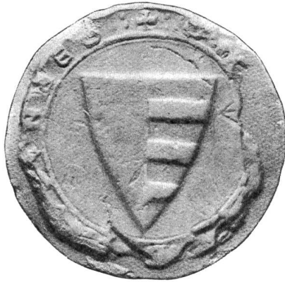
Nr. 2 Siegel von Nr. 7 des Textes (Heinrich II.)