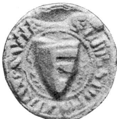
Nr. 4 Siegel von Nr. 15 b des Textes (Christoffel)