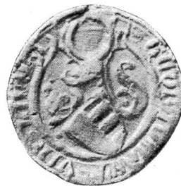
Nr. 16 Siegel von Nr. 30 des Textes (Jörg)