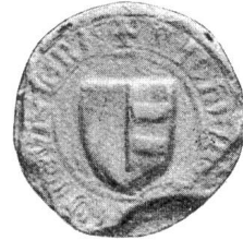
Nr. 12 Siegel von Nr. 26 2 des Textes (Johann)