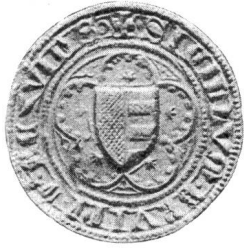
Nr. 10 Siegel von Nr. 23 2 des Textes (Ulrich II.)