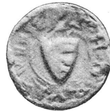
Nr. 6 Siegel von Nr. 16 1 des Textes (Heinrich)