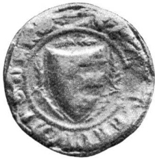
Nr. 1 Siegel von Nr. 14 des Textes (Walter)