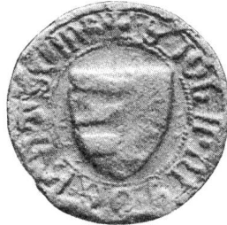
Nr. 11 Siegel von Nr. 26 1 des Textes (Johann)