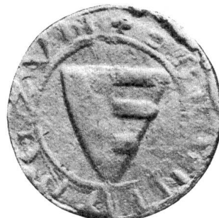
Nr. 9 Siegel von Nr. 23 1 des Textes (Ulrich II. Brun)