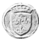
Fig. 79 — D 1 bis Louis d'Orléans — 1515

Depuis la publication du chapitre III sur les sceaux armoriaux, j'ai pu retrouver trois nouveaux sceaux grâce à l'amabilité de MM. Duhem, archiviste du Doubs, Eggimann et H. Jéquier, que je prie de trouver ici mes remerciements.