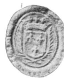
Fig. 80 — D 43 Louis II de Coudé — 1658

Le sceau de Vauthier, bâtard de Neuchâtel, chatelain de Cerlier, qui se rapproche du premier sceau de son père, le comte Louis, est l'oeuvre d'un excellent graveur (E1 bis — 1409/12 — fig. 78).