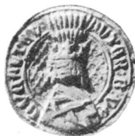
Fig. 78 — E 1 bis Vauthier, bâtard de Neuchâtel — 1409/12