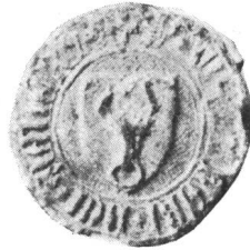
Fig. 39. 9. XII. 1417.