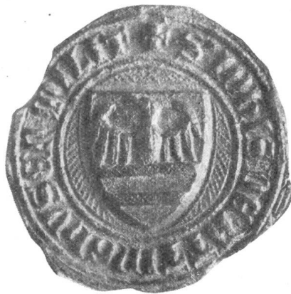
Fig. 33. 20. XI. 1357.