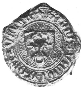
Fig. 36. 10. VIII. 1374.