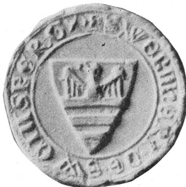
Fig. 30. Werner von Attinghausen 19. XI. 1303.