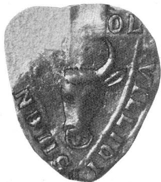
Fig. 29. Arnold von Silenen 10. XI. 1297.

Der Dreieckschild von 36 × 30 mm hat in gotischen Majuskeln die Umschrift: S' ARNOLDI VILLICID. SILENNVN . In der Mitte ist der Stierkopf mit Ring, aber ohne Sternenbeigabe (Siegel-Abb. 29).