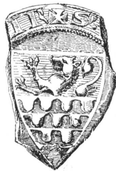
12 3. Siegel von Nr. 9 Otto. 1303