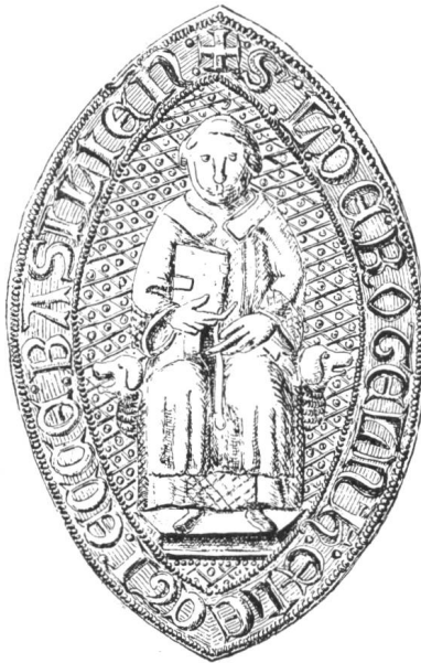
10 5. Siegel von Nr. 8 Liutold II. als Erwählter v. Basel 1309—1310