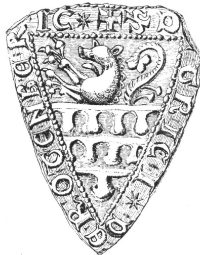
14 2. Siegel von Nr. 12 Dietrich (V.) v. Rotenberg 1270—1272 u. 1278