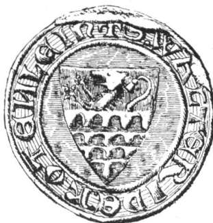
17 1. Siegel von Nr. 14 Walther III. 1297