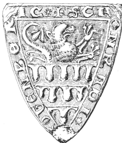
16 2. Siegel von Nr. 13 Konrad II. v. Rotenberg 1258