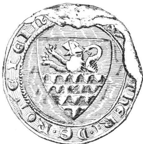
18 2. Siegel von Nr. 14 Walther III. 1303