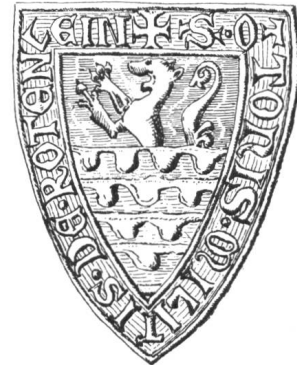
11 2. Siegel von Nr. 9 Otto. 1278—1291