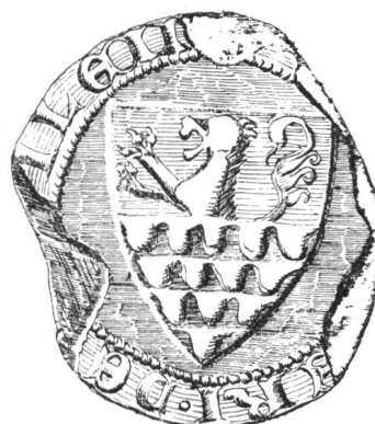
19 3. Siegel von Nr. 14 Walther III. 1308—1310