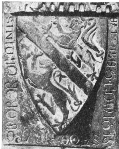
Fig. 2. Armoiries d'E. de Kibourg, 1275.

Fribourg conserve encore un monument aux armes des Kibourg soit la pierre tombale d'Elisabeth de Kibourg, seconde femme de Hartmann le Jeune, morte en 1275 (fig. 2).