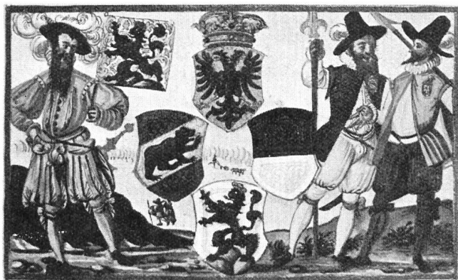
Fig. 3. Armoiries du bailliage de Grasbourg dans la Chronique de Ryff.

Grasbourg. Les bonnes relations qui existaient au commencement du XV e siècle entre Berne, Fribourg et la Savoie, déterminèrent le duc Amédée VIII à vendre