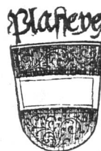
Fig. 11. Armoiries de Planfayon.