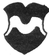
Fig. 5. Armoiries de Schwarzenbourg d'après la Chronique de Stumpf 1548.

à ces deux villes, le 11 septembre 1423, la châtelainie de Grasbourg avec ses dépendances de Schwarzenbourg et de Gouggisberg. Par un accord passé entre les deux villes, cette seigneurie fut érigée en un bailliage commun administré à tour de rôle par un bailli bernois et par un bailli fribourgeois qui résidaient au commencement au château de Grasbourg, puis dès la fin du XVI e siècle au château de Schwarzenbourg construit en 1573. A partir de ce moment le bailliage prit peu à peu le nom de cette dernière localité et subsista jusqu'à la révolution en 1798. Par la constitution du 12—26 mai 1801 son territoire fut attribué à Fribourg seul, mais le 27 février 1802 il fut rattaché uniquement à Berne. Ce bailliage avait relevé les armes d'une famille dite de Grasbourg, bourgeoise de Berne, connue dès le XIII e siècle, et qui s'éteignit à la fin du XIV e siècle. Elle portait sur ses sceaux un lion 1) . Les hommes de la châtelainie de Grasbourg marchaient sous leur propre fanion qui est cité en 1455. Sur le vitrail de 1531 on voit pour la première fois les armes de ce bailliage avec ses émaux, mais dans celles-ci le lion est posé sur un mont, soit: d'argent au lion de sable posé