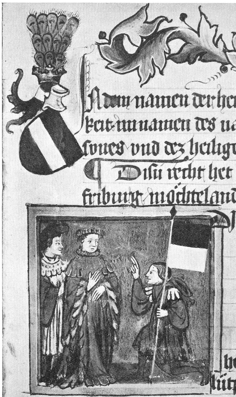
Fig. 7. L'Avoyer de Fribourg prêtant serment au duc d'Autriche et tenant la bannière de Fribourg. Au-dessus es armes du duc d'Autriche. Manuscrit de 1410.

De la bannière de l'Auge dépendaient: Guin, Tavel, Uberstorf, Heitenried, Wünnewyl et Bösingen.