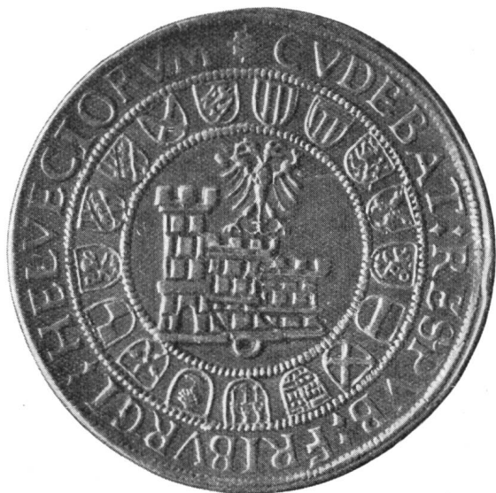
Fig. 9. Ecu de Fribourg, avec les armes de ses bailliages, frappé vers 1530 (agrandissement).

Les Cantons suisses qui, dès la seconde moitié du XV e siècle et le commencement du XVI e siècle avaient conquis ou acquis de nouvelles terres, étaient fiers de ces agrandissements territoriaux et tenaient à en faire montre. Aussi lorsqu'ils firent frapper de nouveaux écus les ornèrent-ils des armoiries de leurs différents bailliages entourant les armes de l'Etat. Ainsi Berne fit frapper un écu de ce genre dès 1490, Soleure vers 1501, Zurich en 1512, Lucerne en 1518 et Fribourg vers 1530. Cet écu que nous reproduisons ici (fig. 9) est