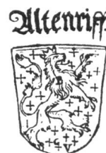
Fig. 8. Armoiries d'Hauterive.

Cette abbaye portait les armes de l'ordre de Cîteaux ou de St-Bernard, soit: de sable à la bande échiquetée d'argent et de gueules, écartelées avec celles qui avaient été attribuées à Guillaume de Glâne le fondateur d'Hauterive, soit: de gueules semé de croisettes d'argent, au lion d'or brochant sur le tout (fig. 8). Par contre la terre d'Hauterive n'était représentée dans la série des armes des terres et bailliages que par les armes seules de son fondateur, mais souvent avec des variantes dans les émaux.