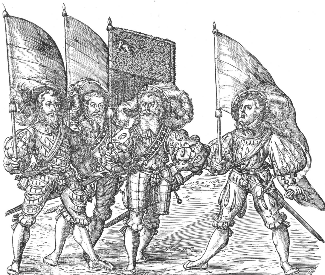
Fig. 6. Les quatre bannerets de Fribourg sur le plan de cette ville gravé par Martin Martini en 1604.

qui entourait la ville était formé de fiefs appartenant aux comtes de Tierstein et tenus pour la plupart par des vassaux qui pour avoir l'appui de Fribourg s'étaient fait recevoir bourgeois de cette ville. En 1442 Fribourg acheta tous ces fiefs du comte Jean de Tierstein et la vente en fut ratifiée par l'empereur Frédéric III en qualité de suzerain 1 ).