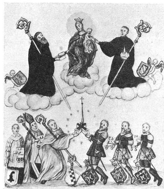
Fig.13. Die Gründer von Lützel mit ihren Wappenschilden.