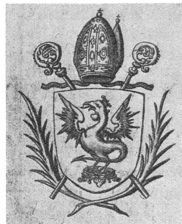
Fig.12. Wappen des Abtes Bernardin Buchinger von Lützel.

Bâle 1884/86, Bd. I. pag. 143, in Originalgrösse, weshalb hier auf eine Wiedergabe verzichtet werden kann. Leider vermisst man dabei die nötigen Aufschlüsse und doch bietet das Bild, auch heraldisch, viel des Interessanten. Wir veröffentlichen dafür die Handmalerei aus Walch, Bd. I. pag. 131, welche nach der obigen Vorlage ausgeführt wurde und mit Ausnahme der fehlenden Putten und Engelsköpfe sowie des Wappens Abt Bernardins, die nämlichen Figuren und Wappen und in der nämlichen Anordnung wiedergibt (Fig. 13).