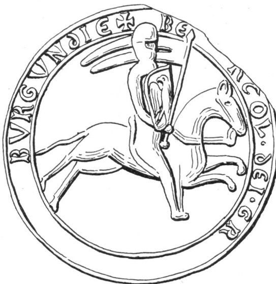
Fig. 53. Sceau de Berthold V, duc de Zähringen.