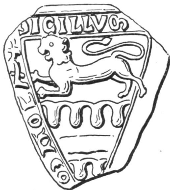
Fig. 54. Sceau de Rodolphe d'Urach, 1228.

Les comtes de Fribourg descendent en effet 3) d'Egon IV le Barbu, comte d'Urach, qui avait épousé Agnès de Zähringen, sœur et héritière du dernier duc,