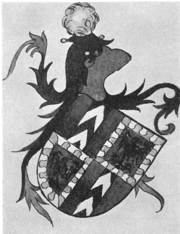
Fig. 60. Le comte de Fribourg et de Neuchâtel. Livre des fiefs de l'évêché de Bâle. 1441.

Comme cimiers, les comtes de Fribourg et Neuchâtel ont porté sur leurs sceaux uniquement la boule et le coussin 1) . Un cachet de Jean porte cependant le panache du comte Louis 2) . Dans un autre document de l'époque, l'armorial de Donaueschingen (1433) nous voyons le cimier des Neuchâtel, le bouquet de plumes coupé d'argent et de sable, mais arrangé en forme de boule (fig. 61) au lieu d'être droit