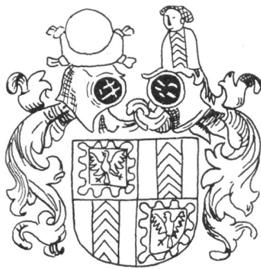
Fig. 62. Varenne de Neuchâtel, comtesse de Fribourg. Chronique de Stumpf, 1548.