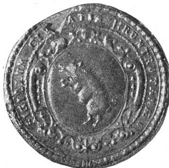
Fig. 84. Sceau du commencement du XVIIIe siècle.