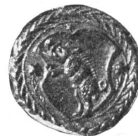
Fig. 82 Petit sceau de Porrentruy du XVIIe siècle.

figurent sur une vue de Porrentruy, gravée au milieu du XVIII e siècle, donnant pour la première fois trois monts soutenant le sanglier (Fig. 83). Enfin pour ter-