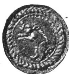
Fig. 81. Petit sceau de Porrentruy du XVIIe siècle.

Mentionnons encore deux petits sceaux du XVII e siècle (Fig. 81 et 82), puis un plus grand du commencement du XVIII e siècle (Fig. 84). Puis les armes qui