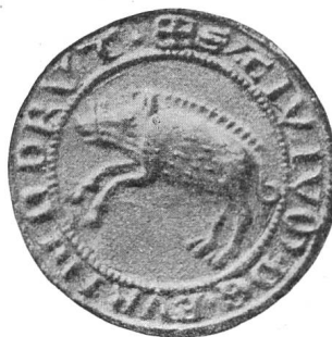
Fig. 79. Petit sceau de Porrentruy.

Mentionnons encore deux petits sceaux du XVII e siècle (Fig. 81 et 82), puis un plus grand du commencement du XVIII e siècle (Fig. 84). Puis les armes qui