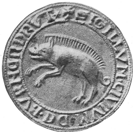
Fig. 78. Grand sceau de Porrentruy fin du XIIIe siècle.

Nous reproduisons encore ici une gravure sur bois aux armes de Porrentruy nous en indiquant les émaux, tout au moins celui du champ, soit V = weiss. Ce bois est tiré de la Chronique bâloise de Wurstisen (1580) (Fig. 80).