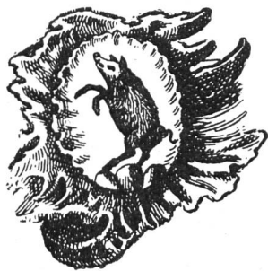
Fig. 83. Armoiries de Porrentruy.

figurent sur une vue de Porrentruy, gravée au milieu du XVIII e siècle, donnant pour la première fois trois monts soutenant le sanglier (Fig. 83). Enfin pour ter-