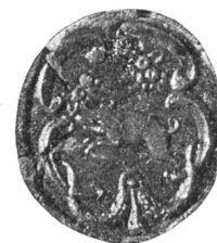
Fig. 85. Sceau de Porrentruy de la fin du XVIIIe siècle.

miner un très joli petit sceau de la fin du XVIII e siècle (Fig. 85) qui vaut la peine d'être reproduit.