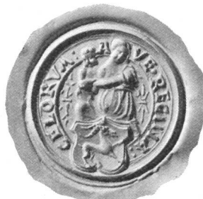
Fig. 113. Siegel des Domkapitels aus dem Anfang des 17. Jahrhunderts.

Anordnung: „Quod noviter receptus canonicus Curiensis cuius Capitulari duos panes azimos triticos et duas mensuras vini Clavenensis, necnon nostrae Ecclesiae panum sericum vel duas marcas argenti pro cappa solvere teneatur, denique iuret servare statuta ac det reversales cautionem numeraria.“ Jeder neuaufgenommene Kanonikus muss jedem Kapitularen zwei ungesäuerte Weizenbrote und zwei Mass Chiavennischen Weines, und überdies für das Chorkleid Seidentuch oder zwei Silbermarken geben, endlich soll er schwören, dass er die Statuten beobachten und die Reversalien und Statuten halten will. Wie die „cappa“ aussah, lässt sich vom Totentanzbild des Jahres 1543 abnehmen. Später ist noch die Rede von einem cuozhut, welcher an der Kopfbedeckung des gleichen Bildes zu erkennen ist (Fig. 112).