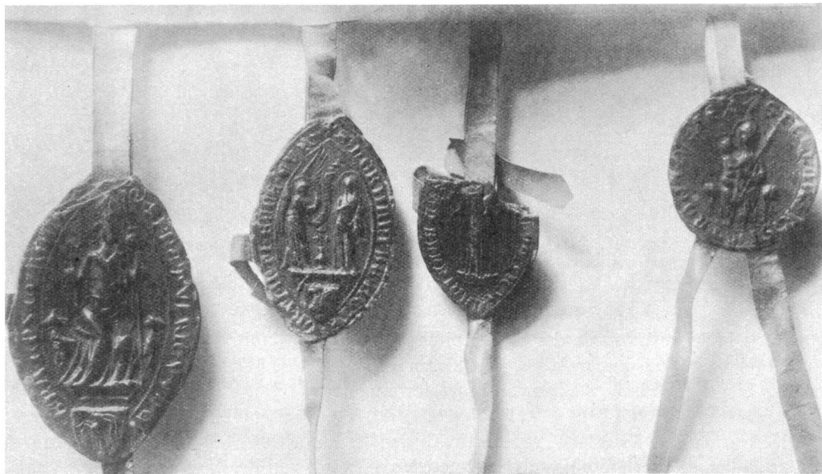
Siegel des Bischofs Ulricus Ribi.