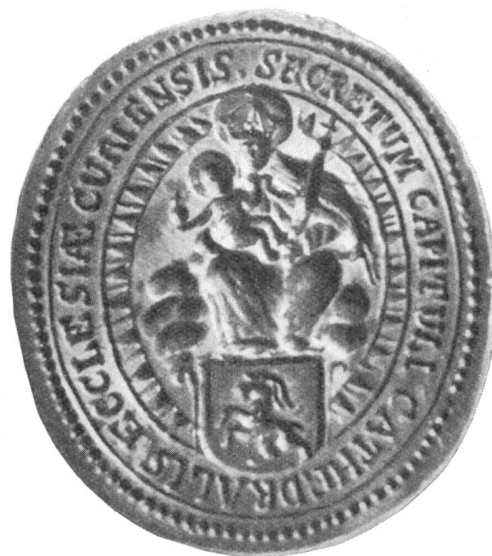
Fig. 115. Siegel des Domkapitels an einer Urkunde von 1683.

man, dass ein anderer Stempel gestochen wurde, weil das angefügte bischöfliche Wappen etwas mehr vom unteren Rand nach der Mitte weggerückt wird, während alles andere gleich bleibt (Fig. 115). Da der Bischof von Chur nicht weit von der Kathe-