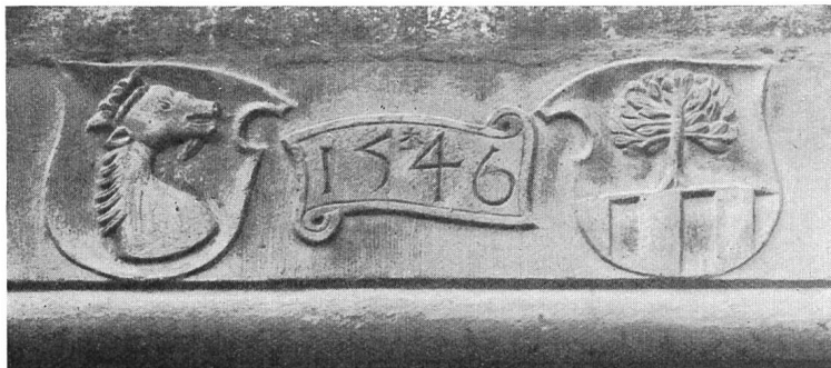
Fig. 116. Wappen Iter und Salis an der Dompropstei in Chur.

Ob dem Toreingang der Dompropstei stehen auf einer Platte das Wappen des Bischofs Iter, mit einem nach links schauenden Rüdennkopf, und dasjenige des Geschlechtes von Salis (auf Gold ein entwurzelter Weidenbaum, der unten fünfmal gespalten in Silber und Rot sich präsentiert) (Fig. 116). Inmitten der Jahrzahl