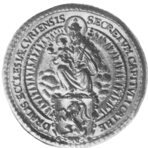
Fig. 114. Siegel des Domkapitels an einer Urkunde von 1664.

Abermals entdecken wir eine Änderung des Siegels im Jahre 1664 an einer Urkunde des bischöflichen Archivs (Fig. 114). Auf dem Siegel lesen wir die Aufschrift: SECRETUM CAPITULI CATHEDRALIS ECCLESIAE CURIENSIS . Das Wappen des Bischofs ist ebenfalls beigefügt. Schon in einer Urkunde des Jahres 1685 entdeckt