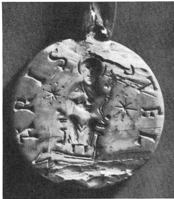
Fig. 109. Siegel des Domkapitels aus dem XI. Jahrhundert.

scheinbare Äusserlichkeiten reden, die doch eine würdige Aussenseite von Dingen grösserer Bedeutung sind. Wir sprechen über Siegel, Wappen, Domherrenkreuz oder Insignien des Churer Domkapitels.