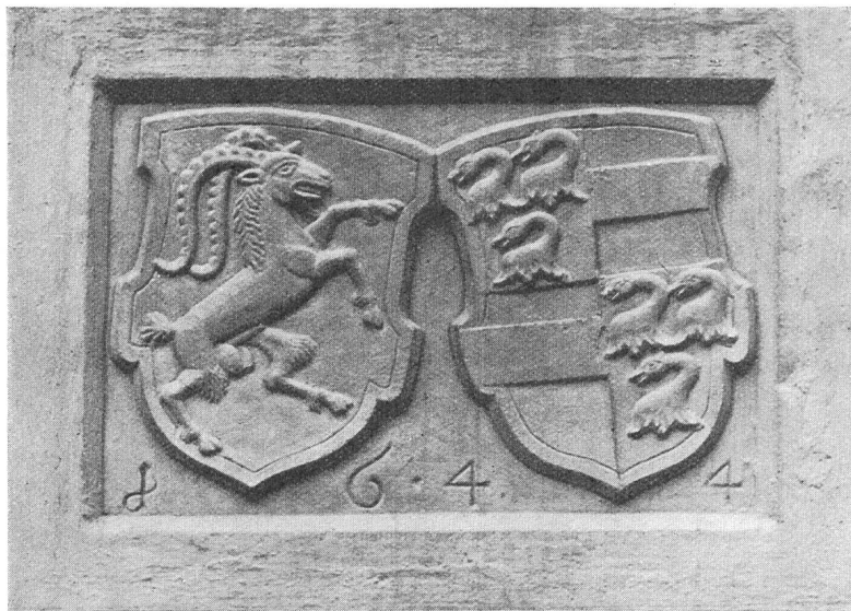
Fig. 119. Wappenplatte am Beneficiatenhaus St. Catharinae: Bistum und von Flugi.

Nach dieser Zusammenstellung des Bistums- und Domkapitelswappens und derjenigen von 1603, also des Hochstiftswappens, das immer wiederkehrt, erkennt man, wie das Wappen des Gotteshausbundes sein sollte, nämlich Madonna und Steinbock. Die Madonna ist nicht bloss Schildhalterin, sondern wirkliche Wappenfigur. Die besonders malerisch schöne Arbeit von Pietro von Salis („Wappen,