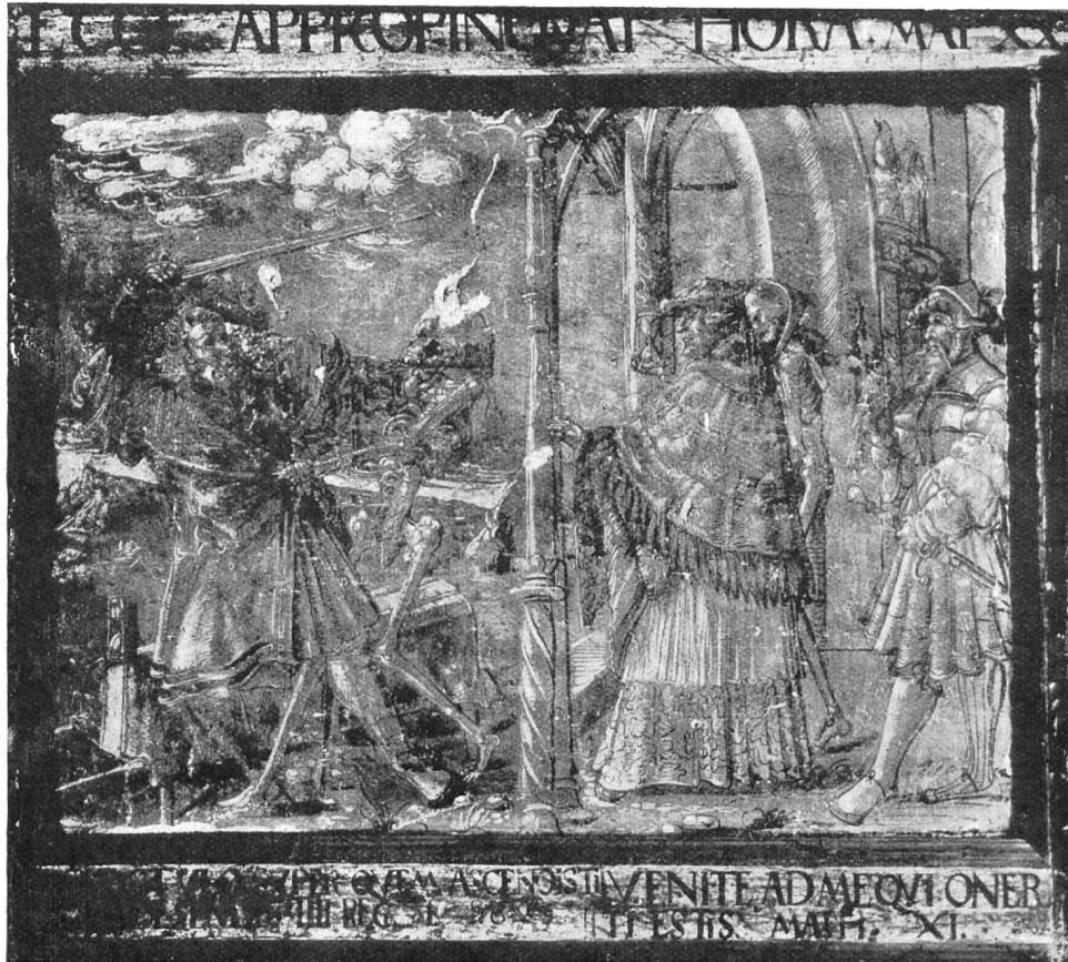
Fig. 112. Kanonikus mit der „cappa“ und dem cuozhut auf einem Totentanzbild des Jahres 1543.

während die anderen Siegel teilweise verletzt sind; darum lassen wir hier die bis an ein Siegel gut identifizierbaren Siegel der dritten Urkunde der Domkapitelsstatuten vom Jahre 1349 (4. Mai) folgen (Fig. 110). Schon in der ersten Urkunde vom Jahre 1273 erscheinen bereits drei Würden des residierenden Domkapitels: der Dompropst, der Domdekan, der Domkustos. Doch sei bemerkt, dass ein Dompropst Egil schon anno 1065 auftritt, während der erste Domdekan sogar 1063 mit dem Namen Victor erscheint. Der erste Scholasticus Eginio findet sich in einer Urkunde von 1154. Ein gewisser Otto erhielt 1237 das Amt des Kantors, und ein Suso