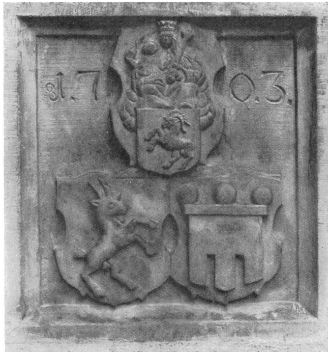
Fig. 118. Wappenplatte des Hochstiftes (Bistum und Domkapitel) oben, unten rechts Hummelberg und links (herald.) Montfortfahne an der Wohnung Beneficii uniti.

Das Domkapitelswappen findet sich auch in Stein gehauen ob der Türe der Benefiziatbehausung des Benefiziums von Hummelberg mit der Jahrzahl 1703 (Fig. 118).