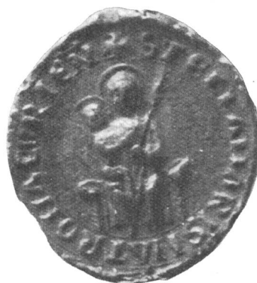
Fig. 110. Kapitelssiegel an den Statuten von 1349.

Diese gut erhaltene Urkunde findet sich im Bischöfl. Archiv. Ursprünglich waren fünf Siegel dran, wozu die Urkunde sagt: Et ut haec robur firmitatis obtineant, praesens scriptum hiis sigiliis videlicet nostro et capituli, Fridrici prepositi, Eberhardi decani, et Alberonis custodis fecimus roborari. „Damit diese Statuten Rechtskraft erhalten, haben wir sie mit unseren eigenen Siegeln (des Bischofs, Dompropstes, des Dekans und Kustos) bestätigen lassen.“ Eine neue Abfassung der Statuten erfolgte 1321 1) . Von beiden Urkunden sind die Siegel des Kapitels abgerissen,