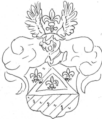
Fig. 62. Pernisch