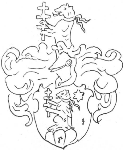
Fig. 61. von Moos

Danz von Zuoz und St. Moritz . Wappen: in schwarz auf blauem Balken eine weisse Gans. Helmzier: wachsender Steinbock.