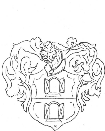
Fig. 55. a Porta

Die Sammlung ist Mitte vorigen Jahrhunderts entstanden.