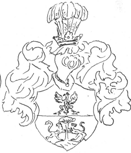
Fig. 56. Battaglia