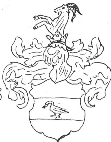
Fig. 57. Davaz