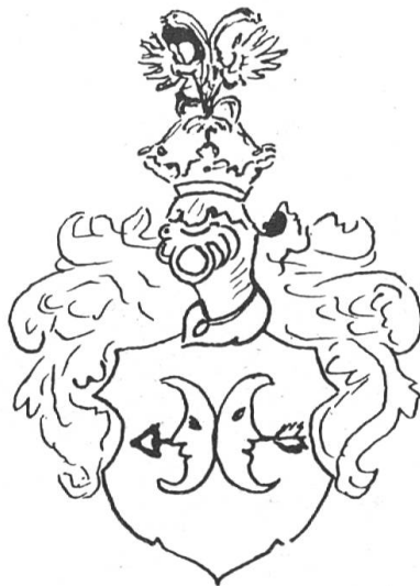
Fig. 59. Jenatsch