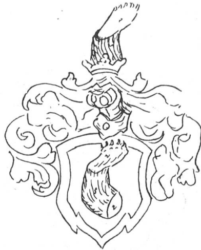
Fig. 63. von Planta

Davatz von Zernez und Schuls . Wappen: geteilt, oben in blau eine goldene Lilie, unten in gold eine weisse Mondsichel. Variante: in blau goldene Lilie und goldener Mond. Helmzier: Lilie über Halbmond.