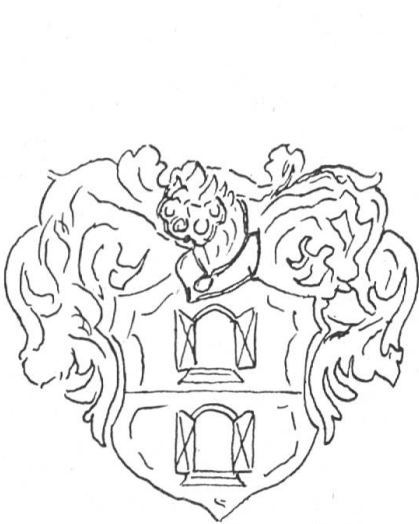
Fig. 55. a Porta

Die Sammlung ist Mitte vorigen Jahrhunderts entstanden.