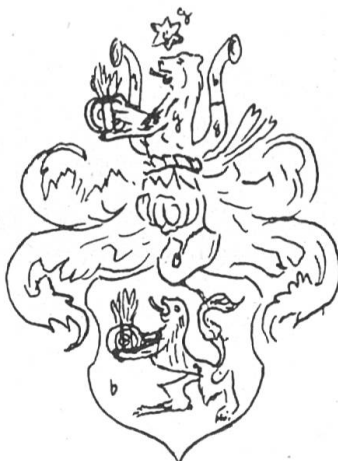
Fig. 65. Raschèr