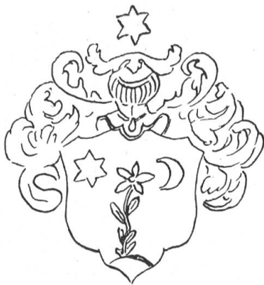
Fig. 58. Ganzoni

Aporta von Fetan und Schuls . Wappen: rot und blau geteilt, zwei goldene Pforten mit schwarzer Öffnung (nach einer Glasscheibe von 1675).