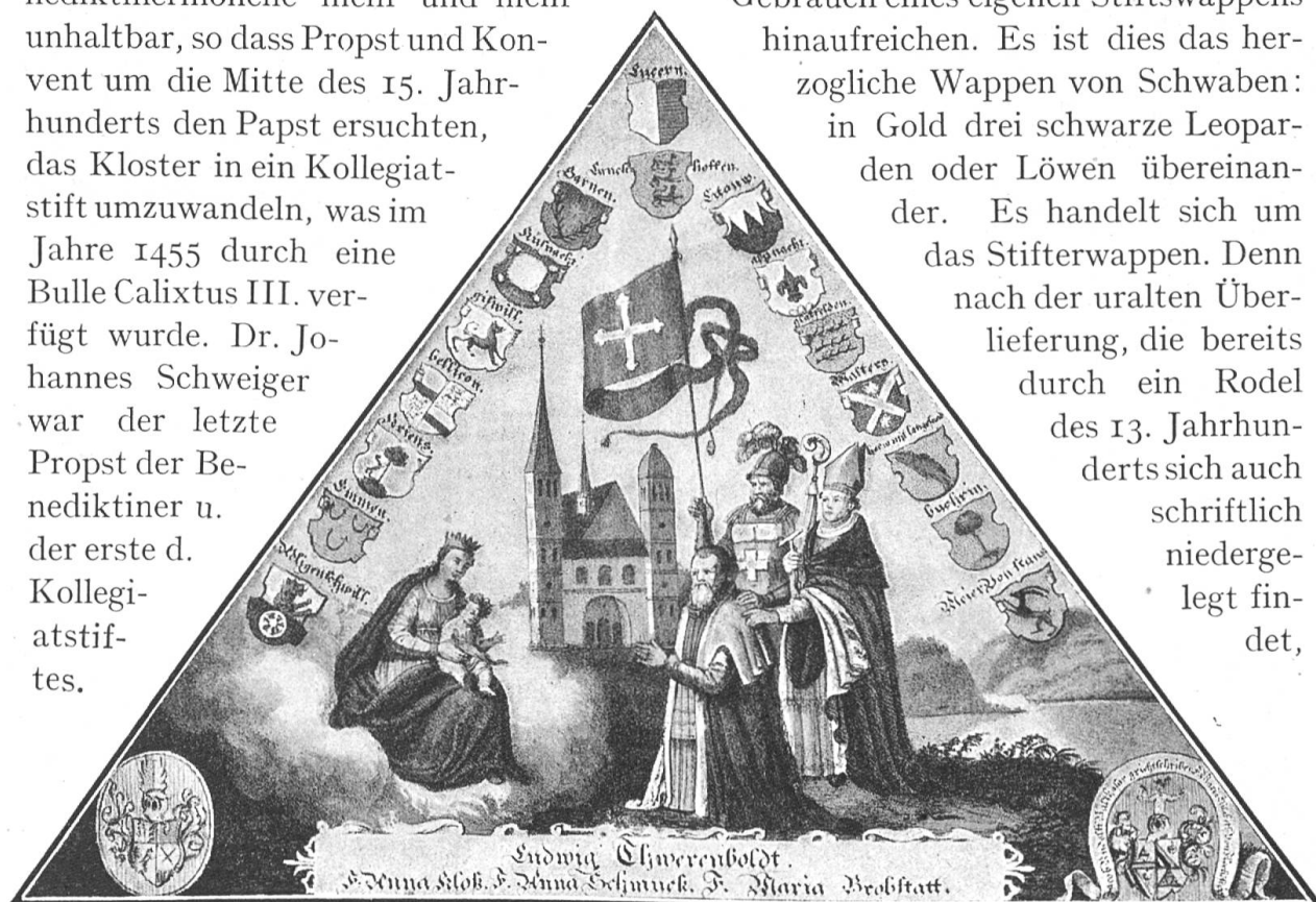
Fig. 97. Die Wichardus-Tafel auf der Kapellbrücke in Luzern.

Die Gründung des altherwürdigen Gotteshauses zu Luzern, dessen älteste Geschichte umstritten ist, reicht sicher ins 8., wenn nicht bis ans Ende des 7. Jahrhunderts zurück. Es war am Anfang wohl eine selbständige Benediktinerniederlassung, später eine Propstei unter der Hoheit des Klosters Murbach im Elsass, dessen geistliche Grundherrschaft bald 15 Dinghöfe umfasste. Im Jahre 1291 ging die Herrschaft durch Verkauf an Österreich über. Nach dem Eintritt Luzerns in den Bund der Eidgenossen wurde der Einfluss des Mutterklosters immer bescheidener und die Stellung der Benediktinermönche mehr und mehr unhaltbar, so dass Propst und Konvent um die Mitte des 15. Jahrhunderts den Papst ersuchten, das Kloster in ein Kollegiatstift umzuwandeln, was im Jahre 1455 durch eine Bulle Calixtus III. verfügt wurde. Dr. Johannes Schweiger war der letzte Propst der Benediktiner u. der erste d. Kollegiatstiftes. Ins 15. Jahrhundert mag auch der Gebrauch eines eigenen Stiftswappens hinaufreichen. Es ist dies das herzogliche Wappen von Schwaben: in Gold drei schwarze Leoparden oder Löwen übereinander. Es handelt sich um das Stifterwappen. Denn nach der uralten Überlieferung, die bereits durch ein Rodel des 13. Jahrhunderts sich auch schriftlich niedergelegt findet,