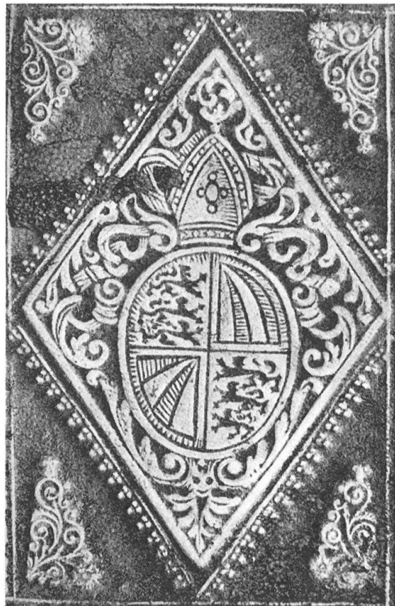
Fig. 101. Superlibros des Propstes J. Knab 1637—1658.

Der kunstsinnige Propst Nikolaus Leonz Ludwig Peyer im Hof (1690—1709) zog ein altes gotisches Stiftssigill wieder zu Ehren: Zu Füssen des hl. Leodegar erkennen wir sein persönliches Wappen (Fig. 102). Seinen Bücherschatz schmückte er als Chorherr wie als Propst mit einigen hervorragenden Exlibris-Stichen 3) .