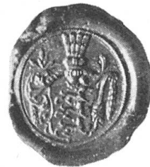
Fig. 105. Stiftsigel.

Man hat auch die Frage aufgeworfen, ob nicht zu unterscheiden sei zwischen dem Stiftswappen und dem Propsteiwappen in dem Sinne, dass der Leopardschild der Propstei, dem Stift aber der stehende heilige Leodegar zukomme. Der letztere findet sich wohl häufig auf Sigillen, sowohl stehend, wie auf einem Throne sitzend. Häufig wurden Siegelfiguren, zumal in welschen Landen, später ohne weiteres als Schildfiguren benützt, selbst wenn ein Wappen schon vorhanden war, wie etwa im tessinischen Meyental (Valle Maggia), dessen richtiger alter Schild