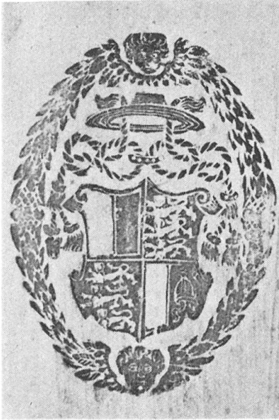
Fig. 100. Superlibros des Propstes N. Schall 1607—1610.

Das Recht zum Gebrauch der Pontifikalien erlangten die Propste erst im Jahre 1777. Auf dem Rückendeckel des gleichen Bändchens findet sich im gespaltenen Schild unter der Heiliggeist-Taube mit Flammen links das Wappen des Stiftes,