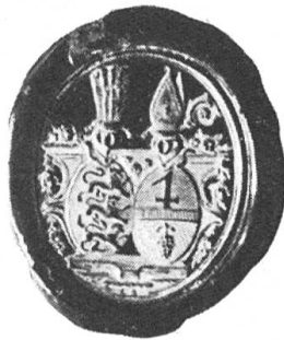
Fig. 103. Siegel des Propstes J. A. Salzmann 1824—28.