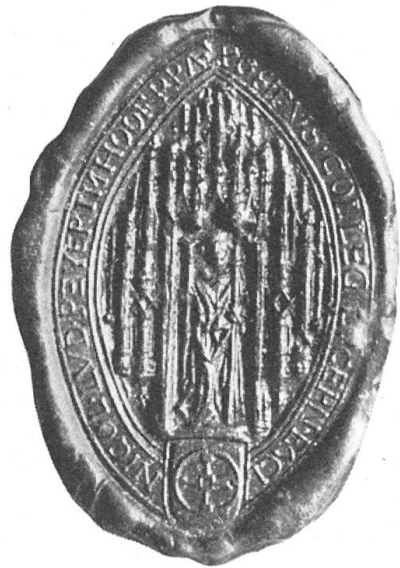
Fig. 102. Siegel des Propstes Peyer im Hof.

Ein Inventar des Kirchenschatzes aus dem Jahre 1660 5) prunkt mit einer feinen Handmalerei auf dem braunen Lederdeckel. In einem kräftigen runden Goldrahmen sehen wir das grosse, volle Stiftswappen mit den Patronen Sankt Leodegar und Mauritius als Schildhaltern (ca. 14 cm Durchmesser).