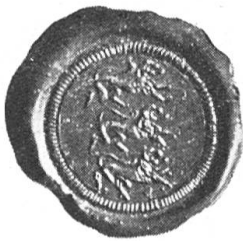
Fig. 104. Stiftsigel.