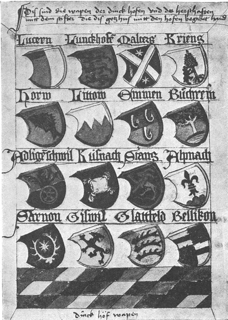
Fig. 98. Wappen der Dinghöfe im Urbar von 1500.

arbeit des Meisters Nikolaus Geissler vom Jahre 1639 2) . Die älteste bekannte Darstellung des Stiftswappens begegnet uns im Matrikelbuch der Universität Basel 3) . Propst Heinrich Vogt war vom 18. Oktober 1490 bis zum 30. April 1491 Rektor dieser Hochschule. Zur Rechten seines prächtigen Familienwappens mit Schildhalter, der das Kleinod trägt, hängt der Luzerner schild, zur Linken der Schild des Stiftes: In Gold drei schwarze Leoparden übereinander 4) .