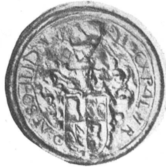
Fig. 116. 77. Karl Franz Schmid. 2. III. 1668.

drei Balken mit Verzierungen. Helmzier: rechts Löwe mit Lilie in den Pranken, links Zipfelkappe. 2 mm grosse Umschrift: IOAN / ES FRANCISCVS / SCHMID / RITHER . Das Ganze ist von einem 2,5 mm breiten Kranz abgeschlossen (Siegelabb. Nr. 115).