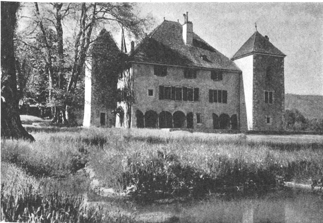
Fig. 127. Château de Gingins, construit vers 1441, par Jean de Gingins.