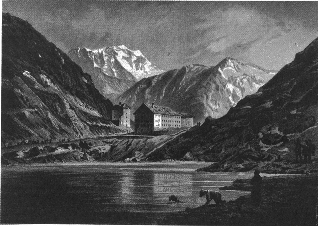
Fig. 6. Passage et Hospice du Grand-St-Bernard, altitude 2470 mètres.

St Bernard de Menthon était chanoine de la cathédrale d'Aoste et l'on croit en général qu'il choisit dans le sein même du Chapitre quelques-uns de ses confrères pour en faire ses auxiliaires dans l'œuvre qu'il venait de fonder. Ce groupe-