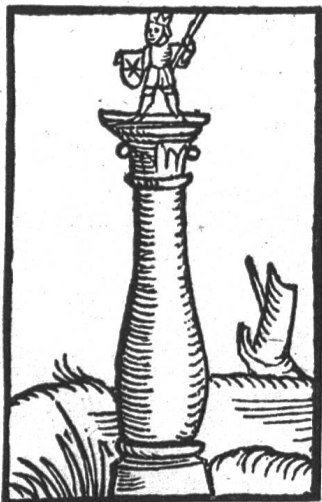
Fig. 7. La statue de Jupiter dans la Chronique de Stumpf 1548.

diques un peu plus tard et reproduira tous les sceaux qu'il a retrouvés et qui sont antérieurs à 1500.