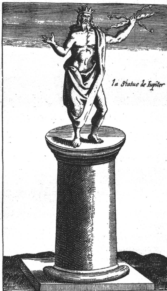
Fig. 8. La statue de Jupiter dans la « Vie de St-Bernard » de Viot. 1627.

La prévôté des Sts Nicolas et Bernard de Mont-Joux fait partie de l'ordre canonial dont St-Thomas dit qu'il a pour objet la vie contemplative dans la célébration des offices divins (Somme IIa IIae 189, viii ad zum). Cet ordre adopta la règle de St Augustin, prescrite par le 2 e concile de Latran en 1139. De là vient qu'on appelle parfois les chanoines réguliers chanoines de St Augustin. A ces caractéristiques de tout l'ordre canonial, la prévôté du Grand-St Bernard ajoute un but particulier: aider les voyageurs à franchir le col du Mont-Joux. Conformément à ce but, ils eurent dès l'origine des constitutions propres. Il ne reste que