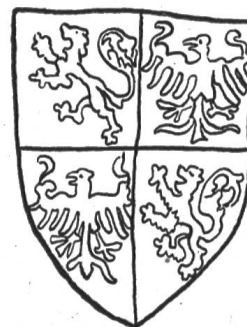
Fig.43. Le comte de Longueville (Arm. Chandon de Briailles, vers 1450).

Parmi les écus écartelés Longueville-Neuchâtel dont il est question page 118 (1937), j'ai omis de signaler une