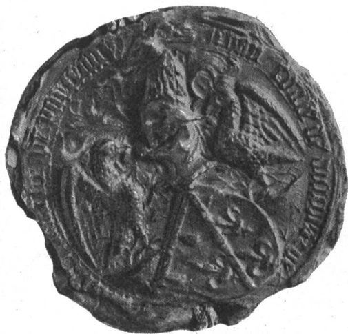
Fig. 45. Sceau de Jean, comte de Dunois (S. IEHAN CONTE DE DUNOIS & DE (Longueville) SEIGNEUR DE PARTENAY).

D'après le P. Anselme ses descendants ajoutèrent à cet écartelé un écusson sur le tout aux armes de Longueville. Ceci est confirmé par un jeton de 1629 d'Henri d'Orléans, marquis de Rothelin († 1651) fils du bâtard François. L'écu y est supporté par deux lions et sommé d'une couronne de prince du sang 1 ).