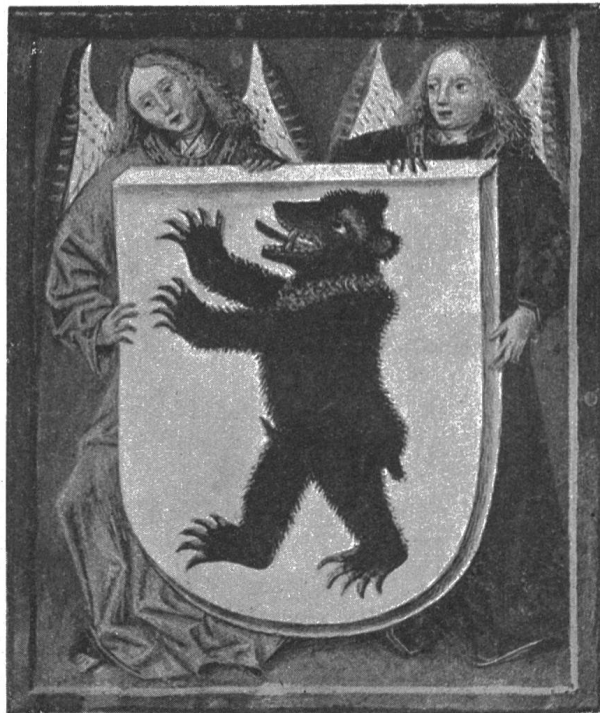
Fig. 69. Wappen der Stadt St. Gallen aus dem Wappenbrief 1475.

Rothmund, 1400. Die Rothmund stammen ursprünglich aus Oberschwaben. Stammvater ist Michael, Stadtschreiber zu Buchhorn, dem heutigen Friedrichshafen. Er ist Mitglied der „adeligen Gesellschaft zum Notenstein“ 1489. Später sind die Rothmund in Rorschach ansässig, gehen zur Reformation über, müssen deshalb Rorschach verlassen und kommen 1560 nach St. Gallen.