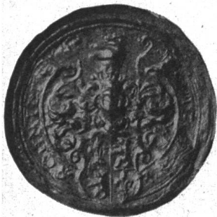
Fig. 97. 103. Joh. Frz. Jos. Schmid 17. XI. 1748

Zur Besiegelung einer Gült vom 17. November 1748 bediente sich Landammann Schmid eines Rundsiegels von 3,2 cm Durchmesser, mit dem gevierten Wappen (1 und 4: Lilie, 2 und 3: Bär) im Schild von 12 × 12/10 mm und mit dem stehenden Bär als Kleinod. Die Umschrift in 1,5 mm hohen Majuskeln lautet: „+ I × F × I × SCHMIDT +“ (Abb. Nr. 97).